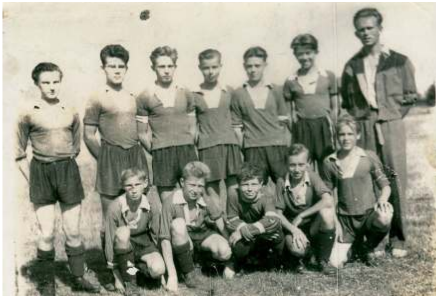
Žáci v roce 1946

V soutěži bylo 16 oddílů. Postup do vyšší soutěže si zajistil celek echie BVB, sestoupilo TEM-