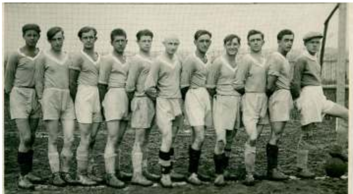
Pro vzpomínky op t n kolik archivních snímk : I. A mužstvo v roce 1936