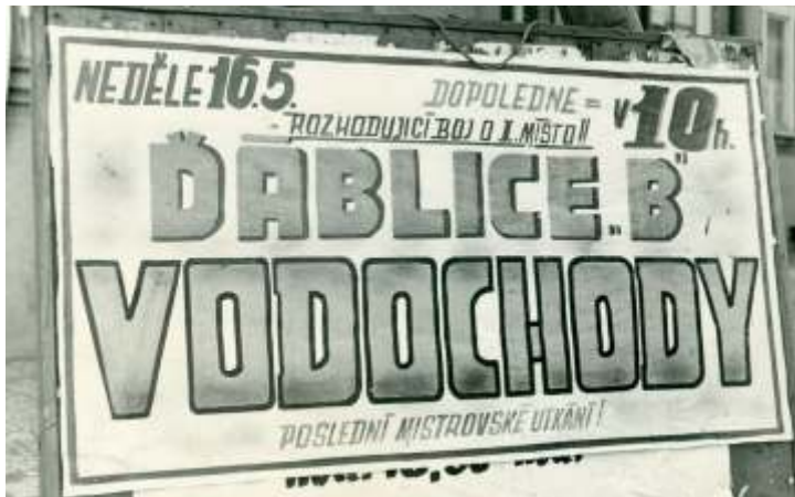
Takto také vypadala propagace k mistr. zápas m. Toto bylo umíst na restauraci "Na r žku" (d íve hotel Veselý).

P es veškeré úsilí realiza ního týmu, trenéra, hrá a p es to, že mužstvo m lo podstatn lepší herní projev než na podzim, tak se nepoda ilo pražský p ebor v áblicích zachránit a mužstvo se po p ti letech vrací p t do I. At ídy.