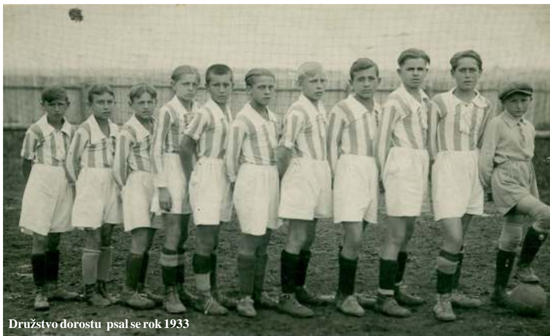
Družstvo dorostu psal se rok 1933