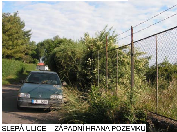
SLEPÁ ULICE - ZÁPADNÍ HRANA POZEMKU