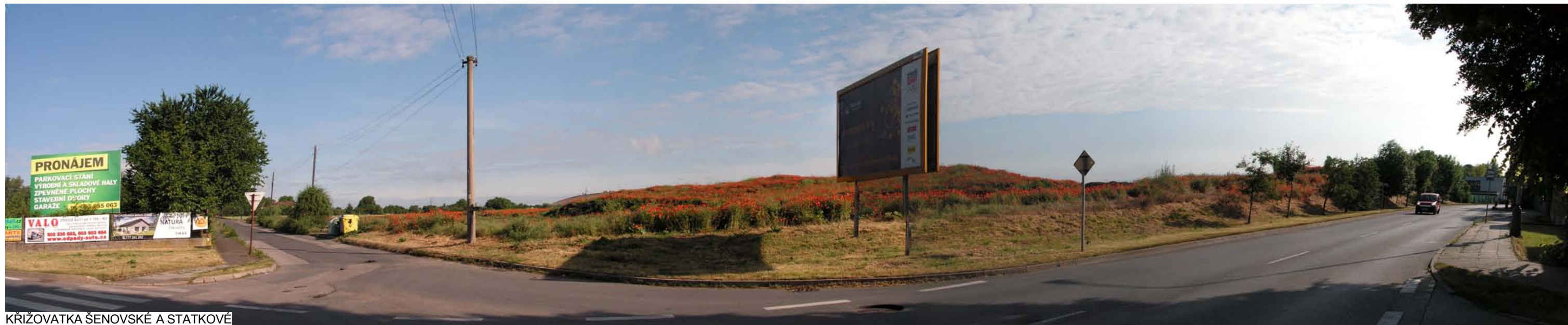
KŘÍŽOVATKA ŠENOVSKÉ A STATKOVÉ