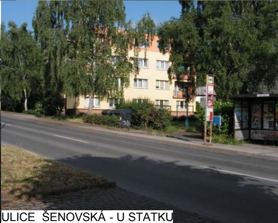
ULICE ŠENOVSKÁ - U STATKU