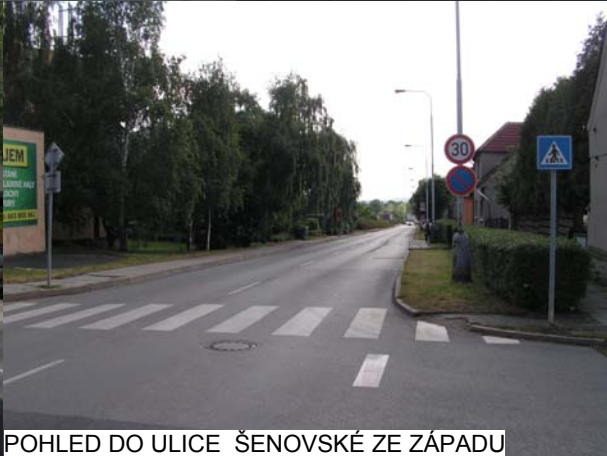
POHLED DO ULICE ŠENOVSKÉ ZE ZÁPADU