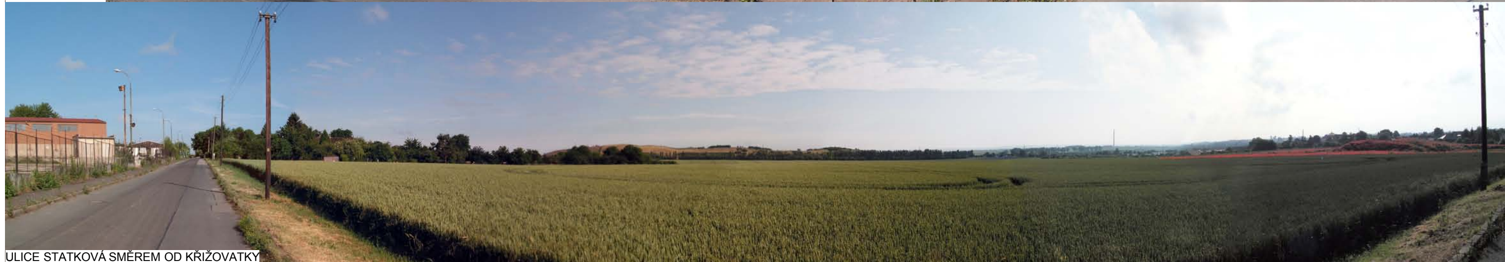
ULICE STATKOVÁ SMĚREM OD KŘÍŽOVATKY