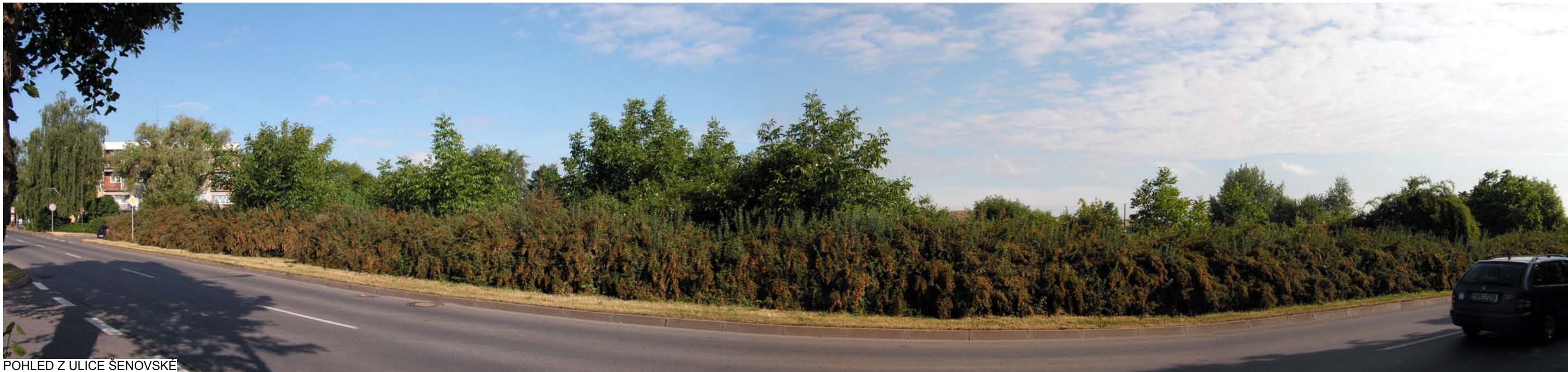
POHLED Z ULICE ŠENOVSKÉ