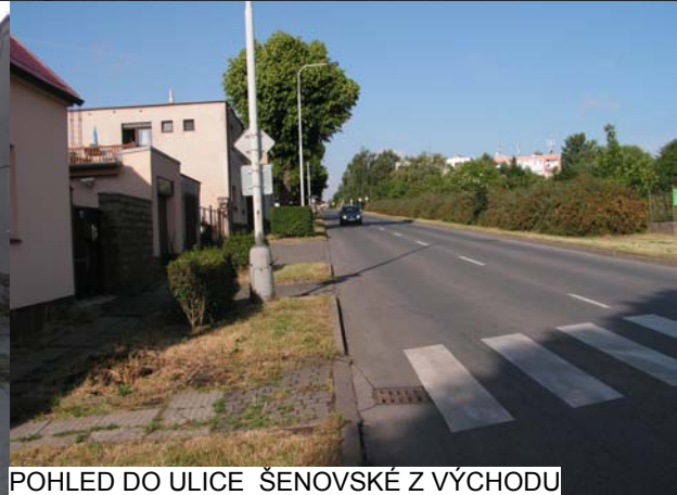
POHLED DO ULICE ŠENOVSKÉ Z VÝCHODU