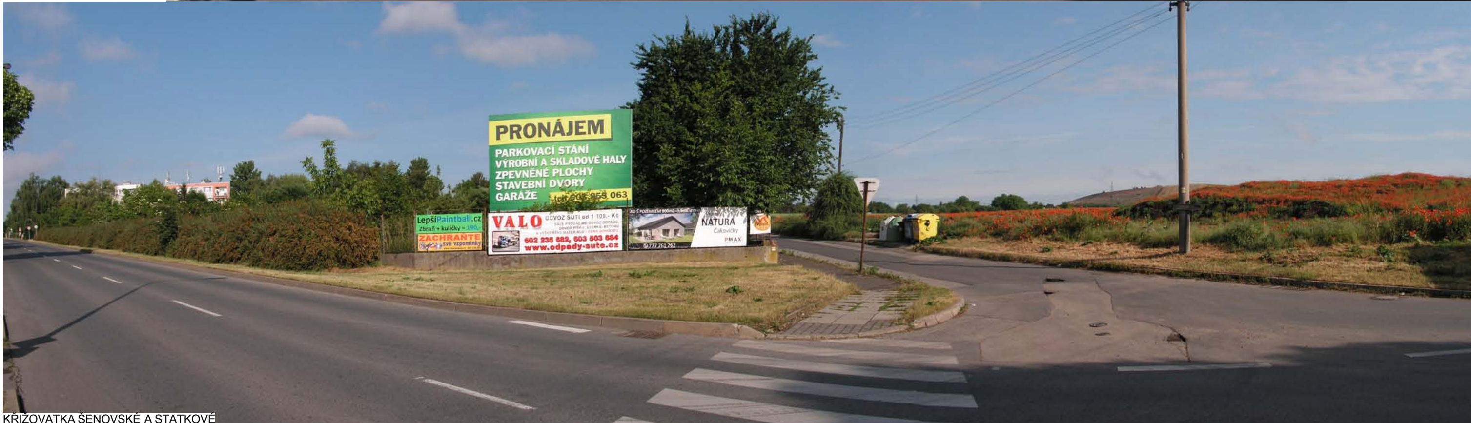
KŘÍŽOVATKA ŠENOVSKÉ A STATKOVÉ