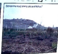
Ochráníme nový zelený pás za skládkou?