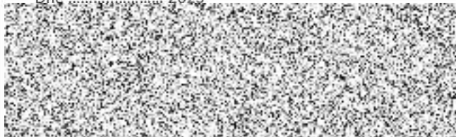
Objednatel (podpis a razítko) Ing.arch Lukáš Kohl, na základě plné moci