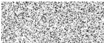
Zhotovitel (podpis a razítko)