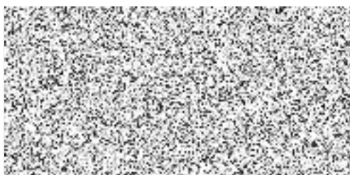
Martina Postupová 1. místostarostka

starostu k podpisu Dodatku č. 12 ke Smlouvě o nájmu pozemku do 30.6.2025, který je přílohou usnesení.