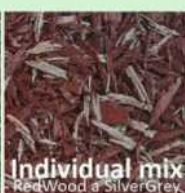
Individual mix RedWood a SilverGrey

Dopadové plochy SOFTNYX včetně herních prvků Lappset dodává ONYX wood spol. s r.o.