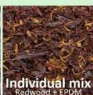
Individual mix Redwood + EPDM