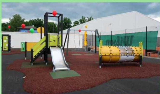
Pro zvýšení odolnosti povrchu jsou exponovaná místa vyztužena pryžovou dlaždicí (výjezd ze skluzavky, pod houpačkami, ...)