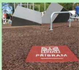
Grafické možnosti povrchu SOFTNYX