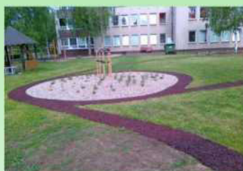
Ukázka využití v zahradní architektuře