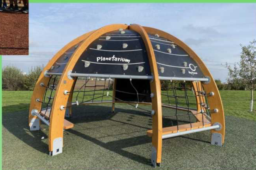
Ukázka realizace pod stávající herní prvky