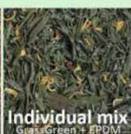
Individual mix GrassGreen + EPDM