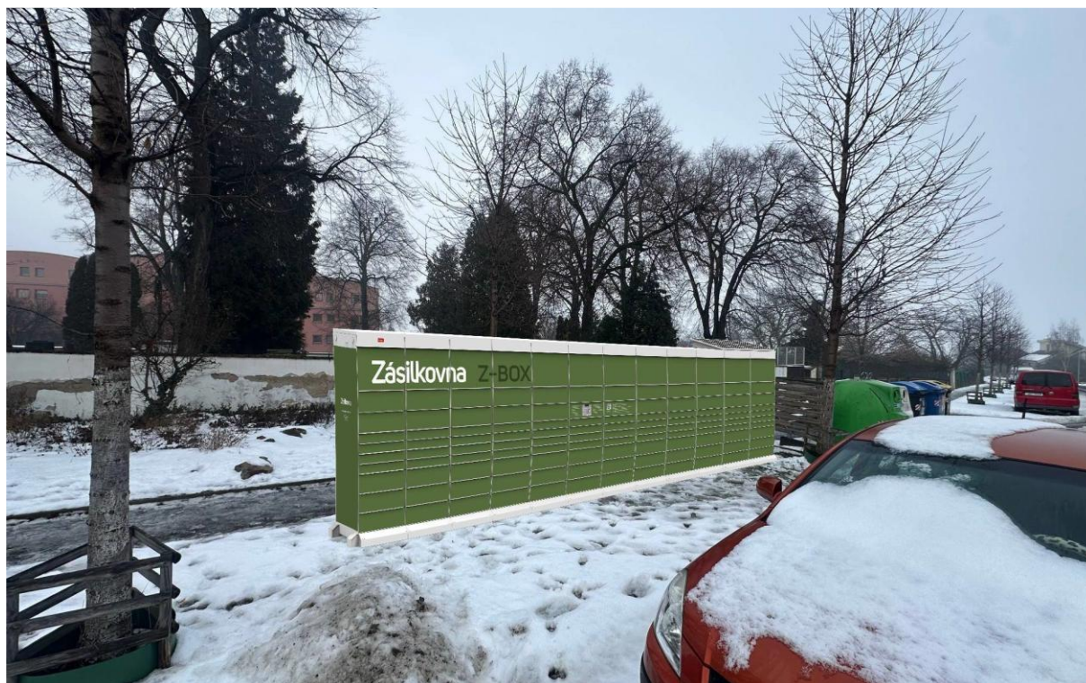
před zdí u hřbitova v ulici K Lomu