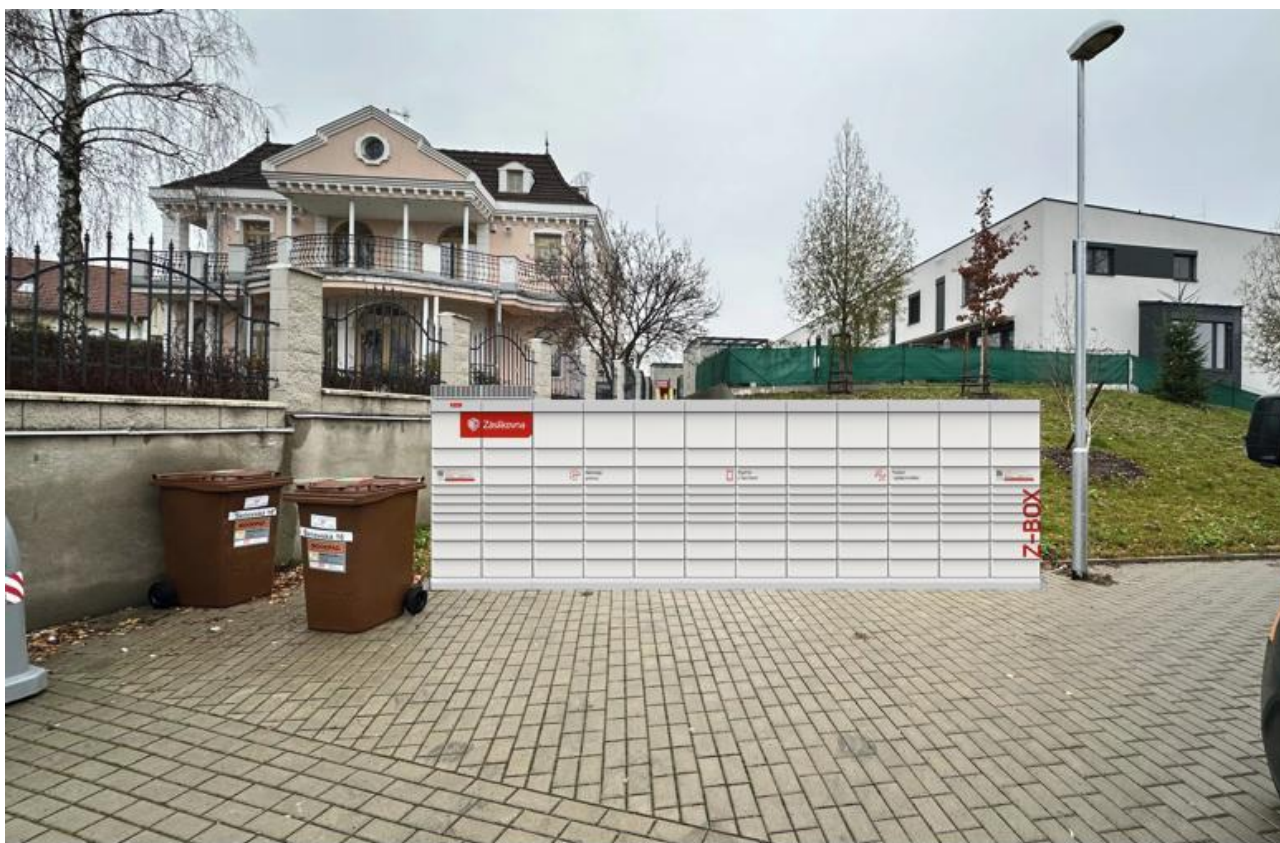
záliv při ulici U Spojů – parc. č. 1562/1