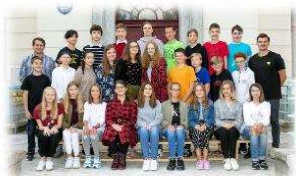
Fakultní ďáblická škola / září 2020