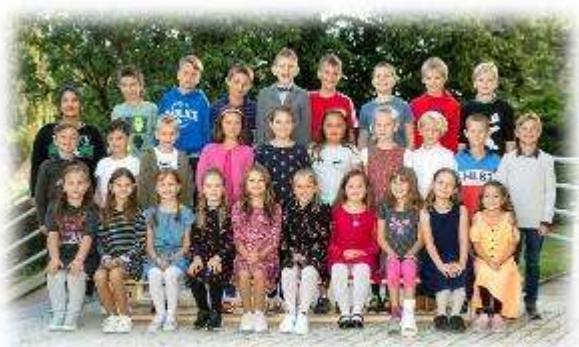
Fakultní d'áblická škola / září 2020