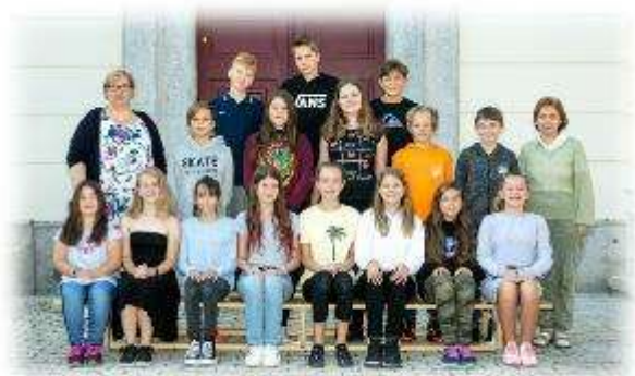
Fakultní d'áblická škola / září 2020