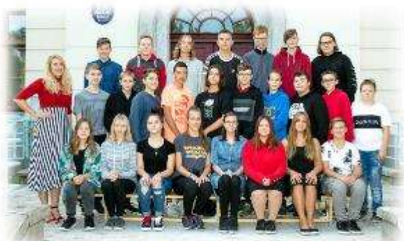
Fakultní ďáblická škola / září 2020