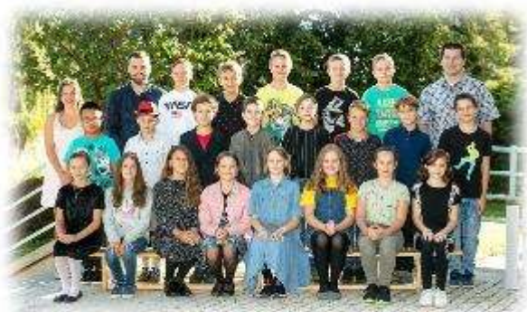
Fakultní d'áblická škola / září 2020