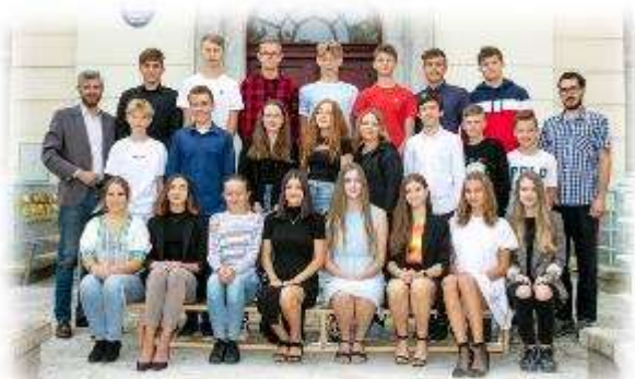
Fakultní ďáblická škola / září 2020