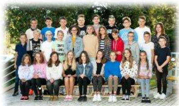
Fakultní d'áblická škola / září 2020