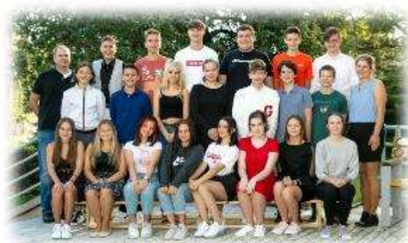
Fakultní ďáblická škola / září 2020