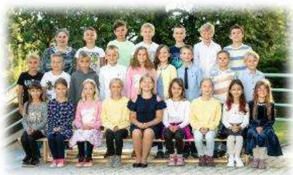
Fakultní d'áblická škola / září 2020