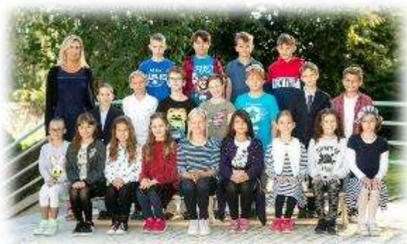
Fakultní d'áblická škola / září 2020