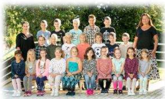
Fakultní d'áblická škola / září 2020