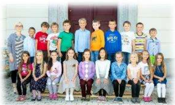
Fakultní d'áblická škola / září 2020