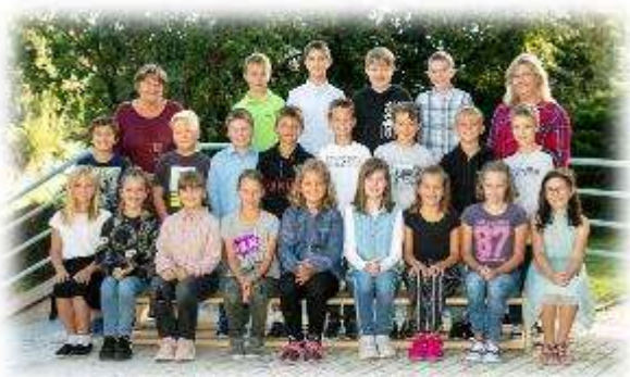
Fakultní d'áblická škola / září 2020