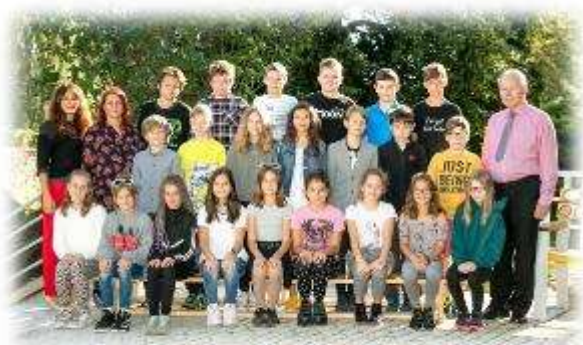
Fakultní d'áblická škola / září 2020