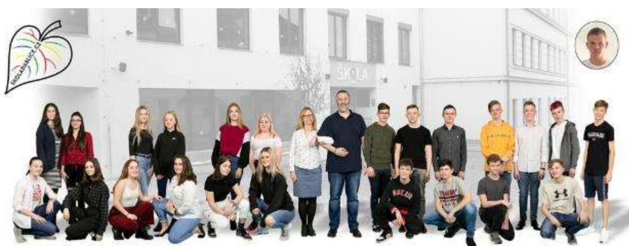
IX. B 2019 / 2020