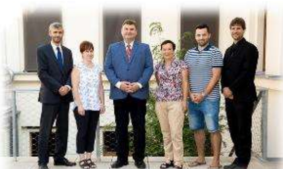
Vedení školy 2019 / 2020