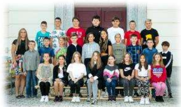
Fakultní d'áblická škola / září 2020