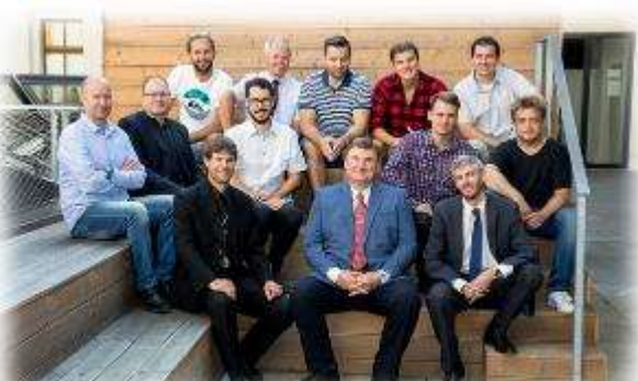
„Chlapi škole“ 2019 / 2020