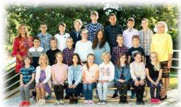
Fakultní d'áblická škola / září 2020