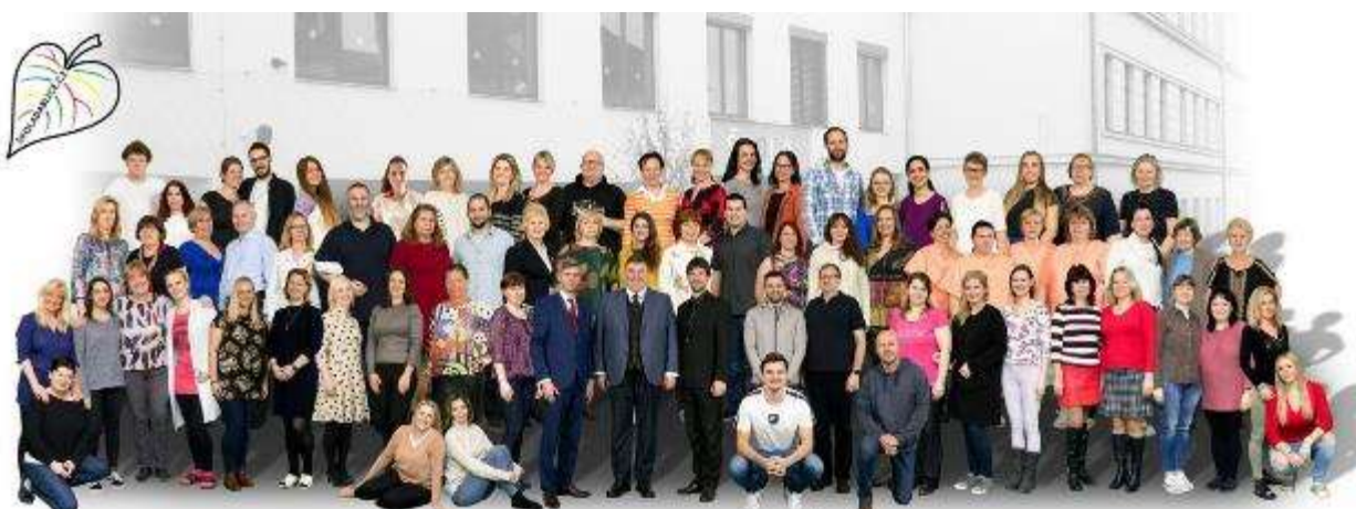
Školní rok 2019 / 2020