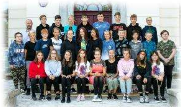
Fakultní d'áblická škola / září 2020