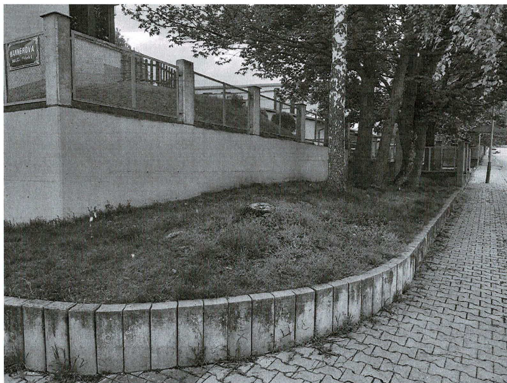
Plocha č. 2 v ulici Kučerové