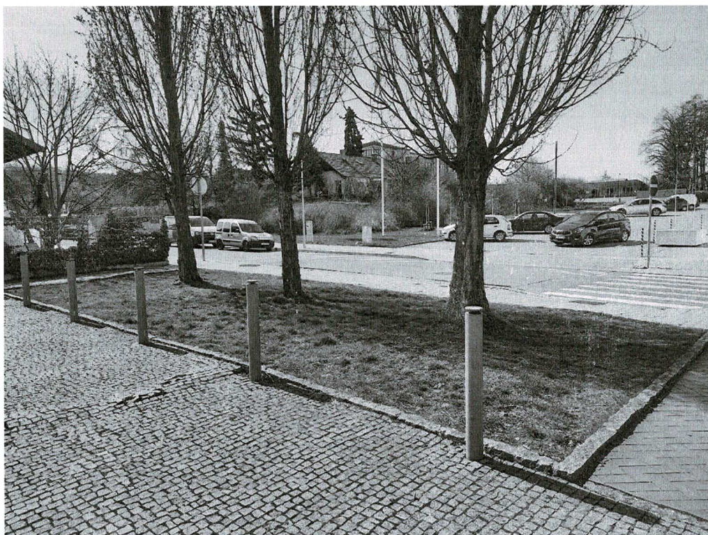
Plocha č. 1 před Battistovou cihelnou