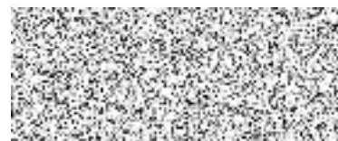
Spolek Parkán člen výkonného výboru