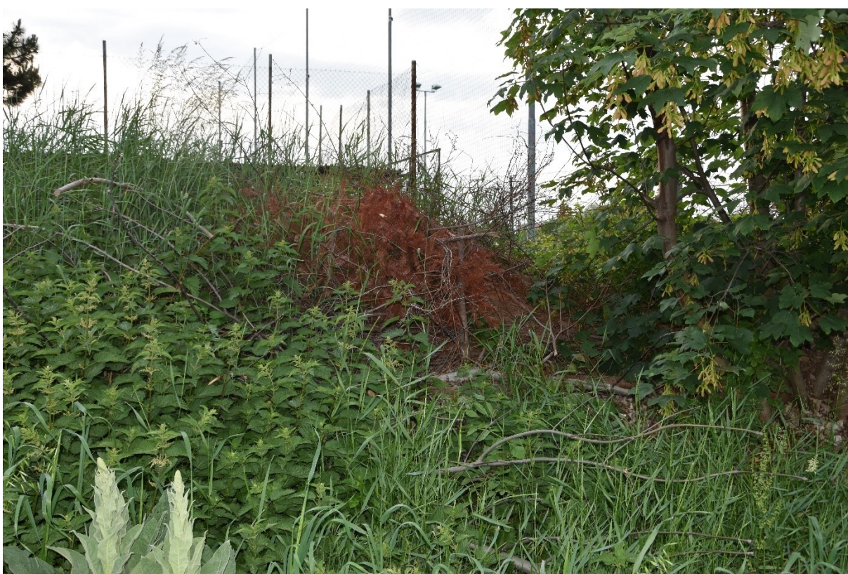
Svah - detailní pohled (kopřivy, plevel, křoviny...)