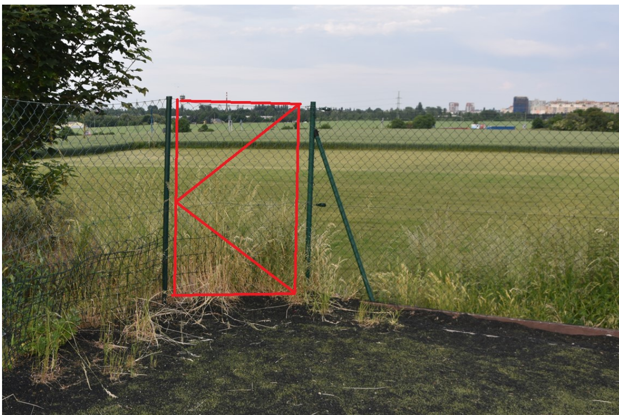
Realizace propojovací branky a lehkých zahradních schodů, které propojí areál SK s loukou - pohled ze hřiště s umělým povrchem