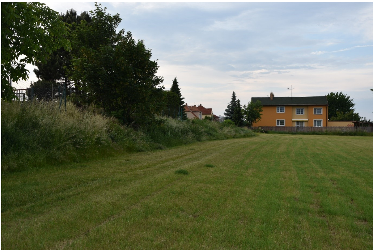
Svah od louky - vzdálený pohled