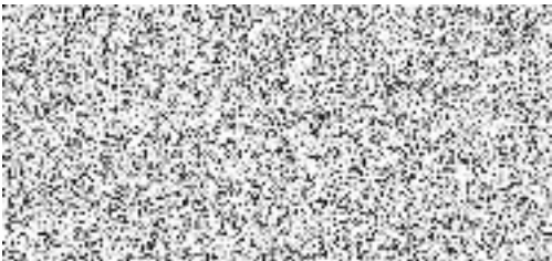
Razítko a podpis zhotovitele