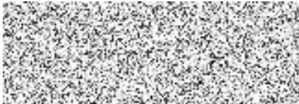
Razítko a podpis pořadatele