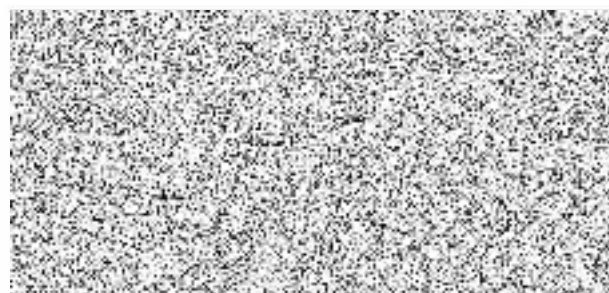
SK Ďáblice, z.s.