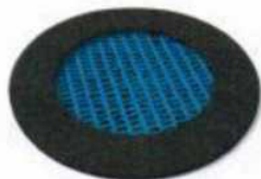
Trampoline Rado 140 Code: MA-SA-02