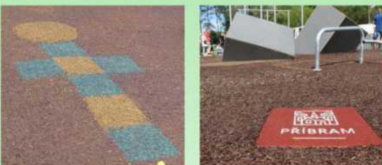
Grafické možnosti povrchu SOFTNYX