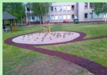
Ukázka využití v zahradní architektuře