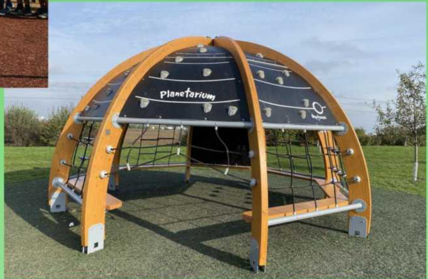
Ukázka realizace pod stávající herní prvky