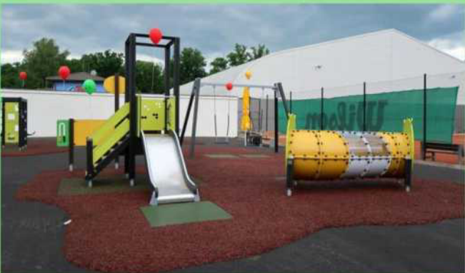
Pro zvýšení odolnosti povrchu jsou exponovaná místa vyztužena pryžovou dlaždicí (výjezd ze skluzavky, pod houpačkami, ...)