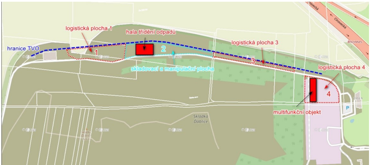
Obrázek: členění ploch a budov

d. Specifikace pozemků a majitelů pozemků – viz tabulka