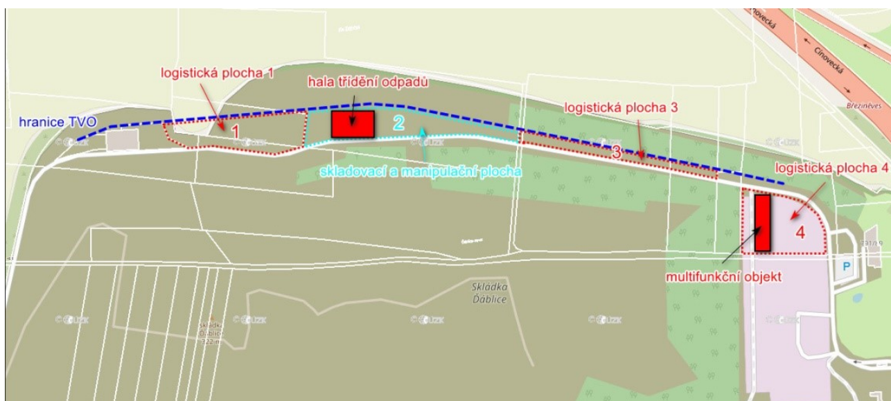
Obrázek: členění ploch a budov

d. Specifikace pozemků a majitelů pozemků – viz tabulka