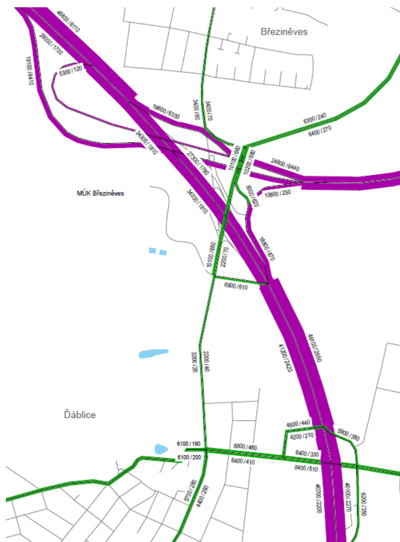
Obr. 2. Výřez přílohy – stav E.2, rok 2030, stav se záměrem DO 520 var. zahloubená, detail MÚK Březiněves (bez DO 518-519)