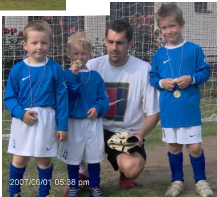
2007/06/01 05:38 pm