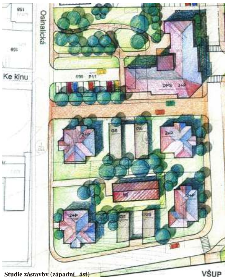
Studie zástavby (západní ást)