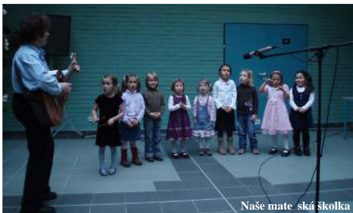
Naše mate ská školka