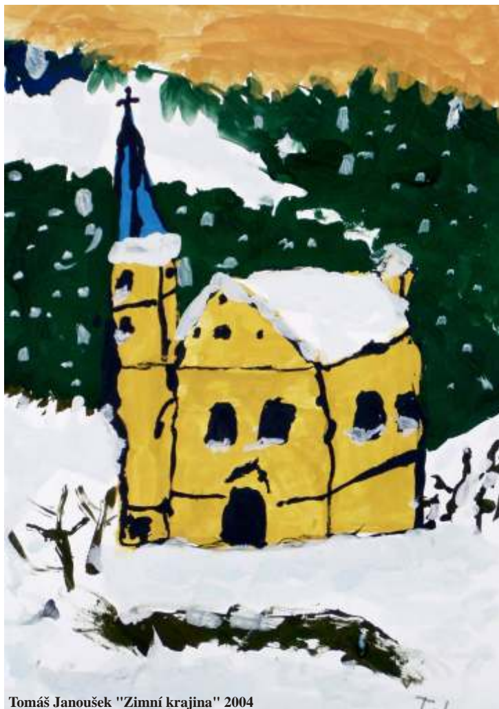
Tomáš Janoušek "Zimní krajina" 2004

Poznámka: Tomáš je stipendistou Celosvětového sdružení malujících úst a nohama, které je v České republice zastoupeno Nakladatelstvím UMŮN.