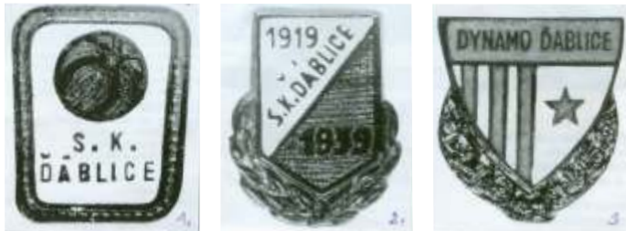
Odznaky vydané k jubileu oddílu 1. založení klubu r. 1919 2. odznak klubu v roce 1939 3. odznak klubu v roce 1959

Pro vlastní sportovní innost bylo nutno zajistit pot ebné finance na nákup dresů, mí, na údržbu hrací plochy, na energii, vodu atd. Oddíl kopané se tak nestaral pouze o fotbal, ale také o společenskou a kulturní innost v obci, jejíž výnos byl využit právě pro tyto pot eby. Proto se pravidelně pořádaly tane ní zábavy Josefská, Silvestrovská, sportovní plesy a karnevaly, které se pořádaly v místní sokolovně v restauraci Na Ržku. Srom tane -