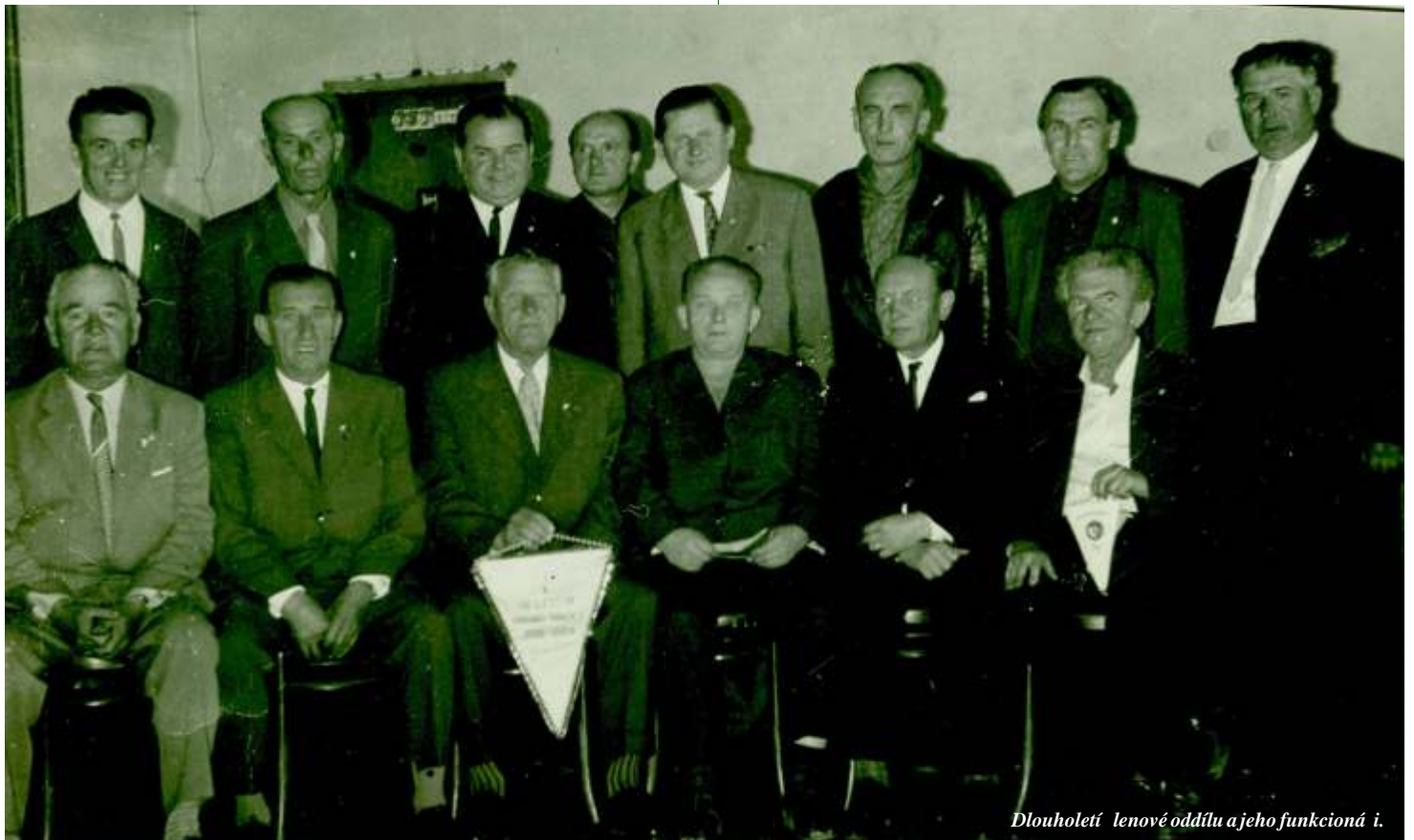
Dlouholetí členové oddílu a jeho funkcionáři.