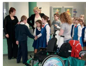
Broučci II Severáčku se zdraví s Pueri Gaudentes

žánrového omezení, který často koncertuje a jezdí po světě. Za pět desetiletí trvání prokázal Severáček své mimořádné kvality mnohými vítězstvími v domácích i zahraničních soutěžích. Ovace publika provázely Severáček na třech kontinentech – ve dvaceti zemích Evropy, v Sýrii, Jordánsku, USA, Kanadě. V Japonsku sbor reprezentoval Českou republiku na Světové výstavě EXPO 2005. Severáček pravidelně natáčí pro rozhlas a televizi, poslechnout si ho můžeme na několika gramofonových deskách a osmi samostatných CD.