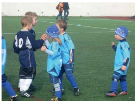
Po zápase si pláceme