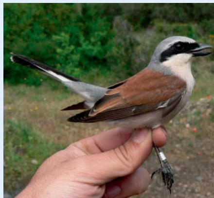
Chycený tuhyk obecný s kroužkem

Při náhodných návštěvách a kroužkování ptáků jsme zde v posledních patnácti letech zaznamenali nečekaně pestré ptačí společenstvo. Zvláště v zimě loví na břehu rybníka a u potoka volavka popelavá. Na vodě lze zastihnout kachny divoké, které zde dokonce hnízdí, pozorovali jsme slípky zelenonohé. Ojedinelé bylo pod-