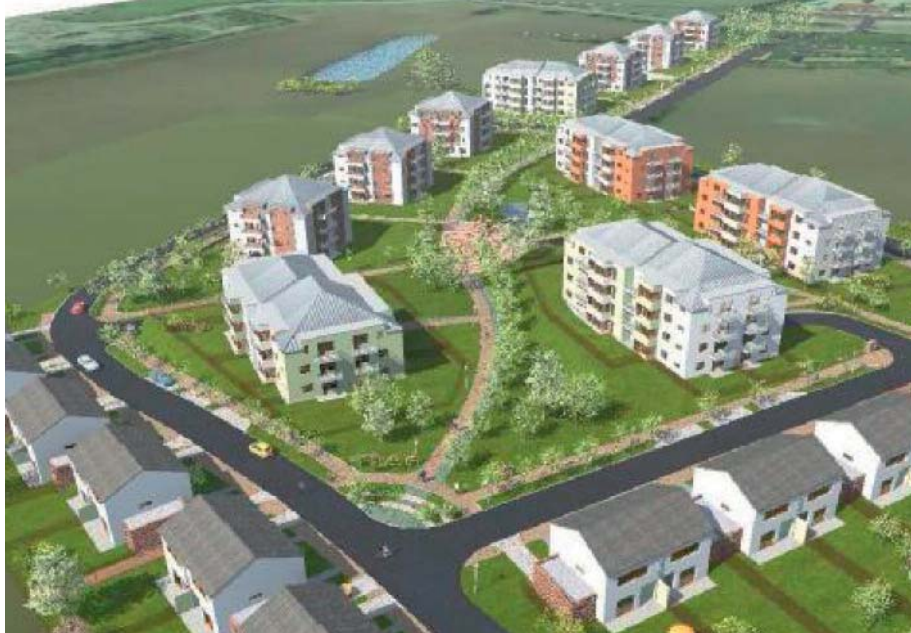
Vizualizace projektu obytného komplexu Ďáblické rezidence, pohled od západu

V záměru předloženém pro zjišťovací řízení dle zákona o posuzování vlivu staveb na životní prostředí není ani slovo o infrastruktuře. Bude se stavět jen obytný komplex, jehož první část by měla být dokončena již v roce 2013. Děti si nejspíše budou hrát na vlastním písečku, projekt na ně pamatuje jedním pískovištěm, jednou prolézačkou a dvěma lavičkami. Teprve v další etapě výstavby, s níž je v budoucnu uvažováno, je naplánována mateřská škola pro 60 dětí. Zkusme si položit otázku: Co přinese tento velkorosý projekt Ďáblicím a jejím občanům? Náhlý nárůst obyvatel téměř o jednu čtvrtinu bude velkou zátěží nejen pro dopravu v již nyní přetížené Ďáblické ulici. Na exponovaných místech v obci budou chybět parkovací místa. Čekací doba na poště či u lékaře se prodlouží. Již nyní je problém umístit dítě do mateřské školy, takto nebude stačit ani kapacita základní školy. Nezapomeňme, že v blízké době budou na území Ďáblic dostavěny tři velké domy s cca 60 byty (na rohu Ďáblické a Hořínecké a u Ďáblického hřbitova nad