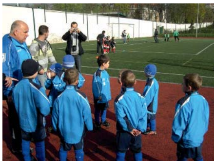
Ze střídačky sledujeme hru jako ostříži

S ohledem na cíl zkvalitnit mládežnickou základnu, bylo rozhodnuto, že náklady na turnaj (6 000 Kč) bude hradit fotbalový oddíl (což není u všech oddílů standard).