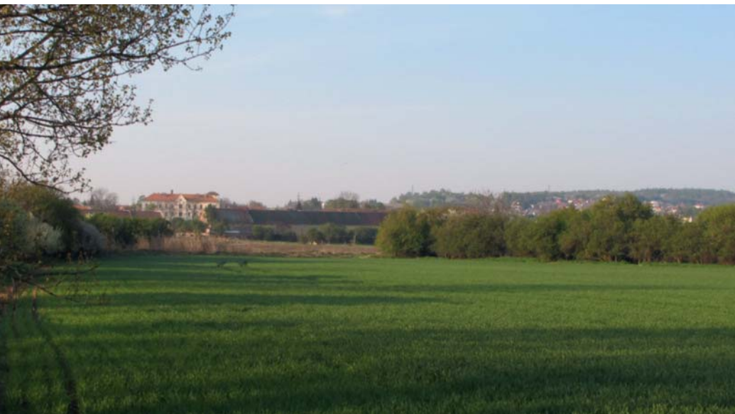
Pohled na centrum Ďáblic od severu. V případě uskutečnění výstavby bytového komplexu by byla pohledově zakryta škola a historické hospodářské budovy a dominantou prostoru by se staly čtyřpodlažní domy

Bytostní optimisté či ti, kdo zastávají názor, že se musíme smířit s negativy, která bydlení na okraji Prahy nutně přináší (jak se kdysi na stránkách Ďáblického zpravodaje vyjádřil bývalý místostarosta), nechť laskavě zváží, zda mají ve čtení tohoto článku pokračovat. Ty, kdo nechťejí zavírat oči před realitou, si však dovolím upozornit na následující souvislosti.