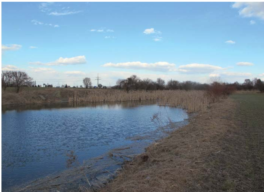
Vodní plocha v centrální části prameniště Mratínského potoka. Na obzoru stromy u Ďáblické ulice

To, co mnohé z nás nenechává lhostejnými např. při četbě novin, z nichž se dovídáme o hrozivém tempu úbytku orné půdy v naší vlasti, se děje také za našimi humny. Projekt „Ďáblických rezidencí“ jakoby ztělesňoval i další ekologický problém, s nímž si naše společnost neví rady, totiž problém úbytku a znečišťování vod. Projekt umísťuje 33 domů do prostoru, který je součástí prameniště Mratínského potoka, aniž by zvažoval, jaký dopad může mít hlubinné založení objektů na pod-