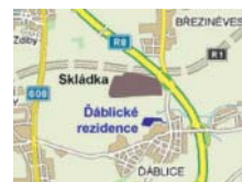
Stavby obytného komplexu „Ďáblické rezidence“ mezi dálnicí a skládkou

Dálnice od okolí neodděluje od okolního prostoru žádné stěny, protihlukové bariéry či valy. I přes urgenci mnohých Ďáblických občanů se s jejich výstavbou zatím nepočítá. A nelze vyloučit, že v budoucnu se situace ještě významně zhorší. V případě realizace jižní varianty severního okruhu kolem Prahy zde bude postavena další dálnice a to pouhý jeden kilometr severně od Ďáblických rezidencí . Nedostí na tom, při křížení obou dálnic bude zbudována jedna z největších dálničních křižovatek u nás. Tím bohužel enormní zátěž na životní prostředí nekončí. Přímou nad severní částí Ďáblického katastru se nalézá letecký koridor. Většina letadel, která míří na ruzyňské letiště, přelétá právě tudy, a protože se před přistáním pohybují v nižší letové hladině,