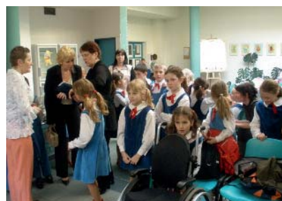
Sbor Broučci II Severáčku se připravuje

získal vysoká ocenění na prestižních festivalech v Neerpeltu, Lindenhofhausenu, Gorizii a vystoupil na mezinárodním festivalu Pražské jaro. Pravidelně účinkuje ve Státní opeře Praha. Osmdesát mladých hlasů pravidelně láká stovky posluchačů na své koncerty v krásných historických