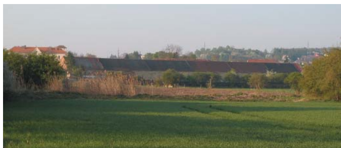
Stodola křížovnického hospodářského dvora z pohledu od severu, od prameniště Mratínského potoka.

Jako příklad unikátní historické stavby, nacházející se v památkové zóně Ďáblic, je možno uvést vrchnostenskou stodolu, která je součástí křížovnického hospodářského dvora, jenž se nachází severně od zámku. Ve středních Čechách jsou relativně často v historických obcích dochovány stodoly zděné konstrukce, obvykle trojdílného uspořádání: perna – mlat s vraty – perna (perna je prostor vedle mlátu, který slouží k ukládání vyláčené slámy, někdy je mezi pernou a mlatem vnitřní příčka či sloupky). Takové uspořádání má i Ďáblická stodola, skládá se však celkem ze šesti mlatů, které jsou lemovány perny. Celková délka historické šestidílné hospodářské stavby u Ďáblického zámku je takřka neuvěřitelných 145 metrů a patrně patří k nejdelším dosud používaným stodolám u nás. Kromě východní části, která je vyzděna z cihel a byla postavena patrně až na konci 19. století, je většina stavby vybudována z místní opuky s tím, že záklenky vjezdů jsou cihlové. Stodola byla postavena před rokem 1841, nejspíše na počátku 19. století. Již v 17. století však na tomto místě stály hospodářské objekty, jak to je patrné na historické pohledové mapě, která zobrazuje stav z přelomu 17. a 18. století.