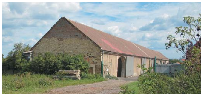
Unikátní 145 metrů dlouhá klasicistní šestidílná stodola křížovnického hospodářského dvora.

zachovat. Prostředí, v němž se nalézají, je však neméně cenné. Kromě několika nevhodných zásahů (např. stavba trafostanice na bývalé návsí) došlo k největšímu narušení památkové zóny při dostavbě školy, kdy za původní historickou kamennou školou vznikl hmotově předimenzovaný objekt, který výrazně zatlačuje starší historickou zástavbu a přístavba školy se tak stala nevhodnou dominantou okolní venkovské zástavby.