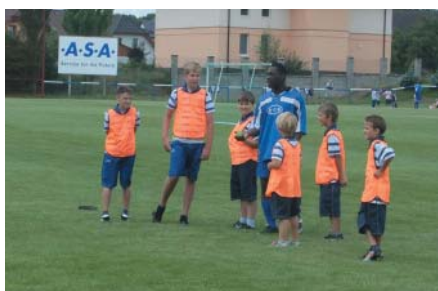
Jeden z trenérů je fotbalový reprezentant z afrického kontinentu