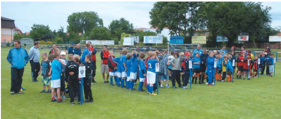
Nastoupení týmů před vyhlášením výsledků

O pohár se utkaly týmy SK Ďáblice (oddíl A + oddíl B), TJ Březiněves, Spartak Kbely, Sparta Praha (dívký), SK Dolní Chabry, SK Třeboradice, FC Lobkovice a ABC Braník. Náladu našťestí