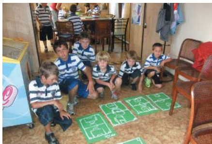
Po obědě jsou hry a němčina