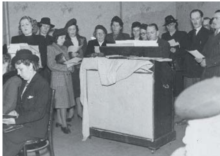
Tento rok se také konaly za hojně účasti půlnoční bohoslužby v hostinci U Vernerů.