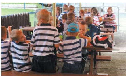
Po sportovních výkonech chutná oběd dvojnásobně