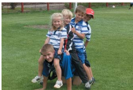
Na závěr je z trenéra koníček