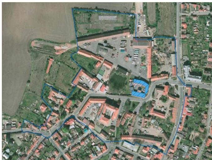
Historické centrum obce s vyznačenou hranicí vesnické památkové zóny Staré Ďáblice, uprostřed zřetelně zámek s kaplí

Památkově chráněná území jsou v České republice rozdělena do několika kategorií podle stupně ochrany a charakteru památek. Jde o památkové rezervace, památkové zóny a památková ochranná pásma. Za památkovou zónu je možné prohlásit sídelní útvar nebo jeho část, historické prostředí nebo část krajinného celku, které vykazují významné kulturní hodnoty. V České republice jsou tak prohlašovány městské památkové zóny, vesnické památkové zóny a krajinné památkové zóny. Jejich prohlášení se děje vyhláškou Ministerstva kultury v Praze, v minulosti též vyhláškou hlavního města Prahy. Vesnická památková zóna má menší koncentraci kulturních památek než vesnická památková rezervace, představuje však – jako historické prostředí nebo část krajinného celku – významnou kulturní hodnotu. Celkem je v České republice vyhlášeno 211 vesnických památkových zón. Na území Prahy byly kromě Starých Ďáblic vesnickými památkovými zónami vyhlášeny ještě Královice, Stará Hostivař, osada Buďánka, Střešovičky, osada Rybáře a Staré Bohnice (zdroj: internetové stránky Národního památkového ústavu a Ministerstva kultury).