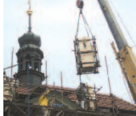
Snímání první sochy z kaple, 10. 9. 2007

Škola, uzavírající návěs, není jen místem jen pro výuku a výchovu dětí, ale v příjemném prostředí