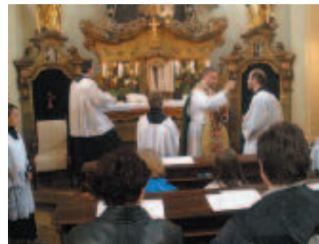
Slavnostní poutní mše svatá, 30. 5. 2010

Není jednoduché získat informace z počátku padesátých let, co se dělo na Ďáblických státcích (podobně jako ve všech obcích v republice). Kontinuita sedlačení byla v krátké době přetržena. Pantáta s širší rodinou byl násilně vystěhován z vlastního domu – v lepších případech na žebříňáku nebo nákladním autem, v horším případě si musel najít bydlení sám. A když se to někomu nelíbilo, např. napsal