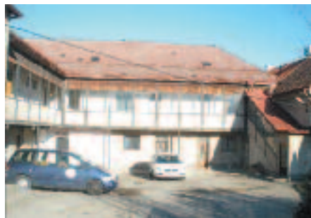
Steyskalův statek, obytná budova, 18. 1. 2012

Návěs měla a má skoro každá česká či moravská obec. Co je to návěs? Vesnická návěs se vyznačuje zpravidla obdélníkovým tvarem, vymezeným zemědělskými usedlostmi, každá s dvorem uprostřed, směrem k návsi je vybudována obytná budova s vjezdem, po stranách dvoru jsou stáje a vzadu stodola, za kterou leží zahrady a pole. Návěs byl prostor, kde se lidé