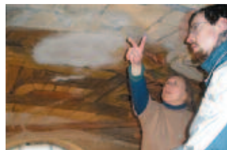
Kontrolní den rekonstrukce stropní malby v kapli, 9. 11. 2010

Je třeba si uvědomit, že se toto budování socialismu na vesnici odehrávalo cca před 60 lety – pantátové nežijí a dětem, pokud si alespoň něco mají pamatovat, je kolem 75 let. V Ďábli-