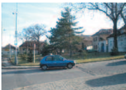
Návěs od školy, 18. 1. 2012

Vraťme se ale k dřívějšímu centru obce, návsi.