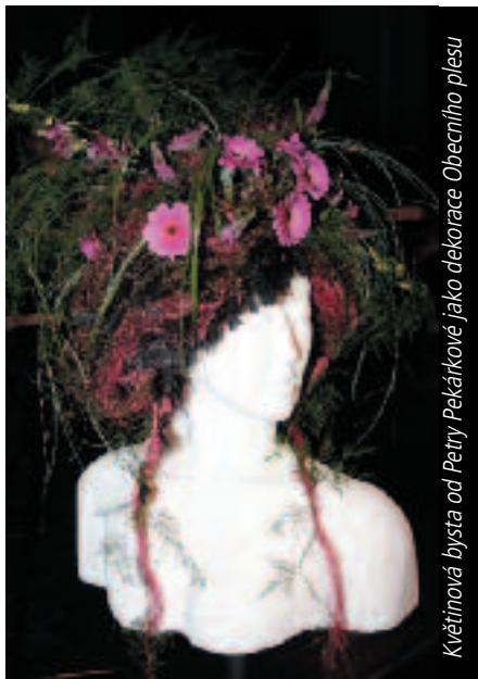
Květinová bysta od Petry Pekárkové jako dekorace Obecního plesu

Kulturní a školská komise společně s Ďáblickou floristkou Petrou Pekárkovou Vás zvou na tvoření Jarní květinové dekorace , které se bude konat ve středu 4. dubna 2012 od 17 hodin v sálu Diakonie.