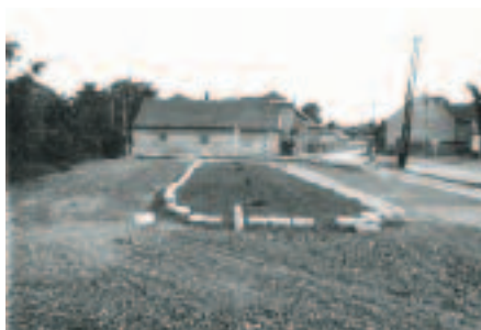
První polovina 80. let – prostor u křižovatky po zbourání historické kovárny, stavba „parkové“ úpravy – vyasfaltovaného oválu s trávnikem uprostřed

sloužit jako skládka, odkladiště. O tomto stavu jsem již tak před čtyřmi lety informoval tehdejší zástupkyni Referátu životního prostředí, ovšem k činnosti v této věci ji to ani v nejmenším nedonutilo. Ve stejném duchu – to znamená „prosím podívejte se na to skladiště, které v takovém rozsahu nemá v zahrádkářské kolonii co dělat“, jsem na jaře v roce 2011 opět informoval i novou zástupkyni referátu. Ta už neotálela a Pozemkový fond donutila k činnosti – pozemek byl vyklizen. Obec tato akce nestála ani korunu. Následně však zahrada nebyla