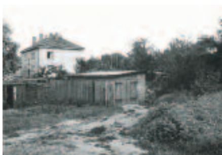
Přelom 80. a 90. let – bytový dům Legionářů čp. 88 ještě bez nástavby

V souvislosti s pronájmy výše uvedených zahrádek si neodpustím ještě jeden výlet do ne tak vzdálené minulosti. Vždy jsem se podívoval,