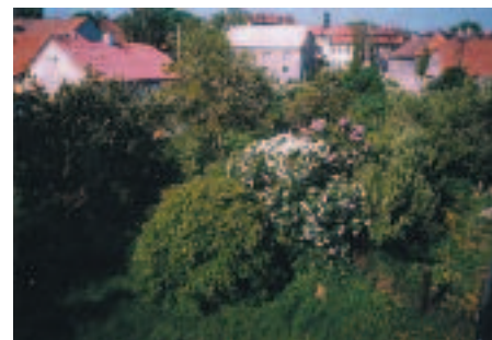
Druhá polovina 90. let – zahrada u křižovatky v místě stávajícího nového rohového bytového domu

a bývalé paní starostce jsem to i při jisté příležitosti řekl, že obec pronajímá zahradu, kde není uvedena jako vlastník. To se následně potvrdilo, ukázalo se, že obec pronajímala zahrady od roku 1999 bez právního důvodu a vybrané peníze pak musela převést Pozemkovému fondu, ač ve zcela první variantě byly snahy, abychom my zahrádkáři zaplatili nájem fondu podruhé. Nedali jsme se. Přitom obec si od fondu pronajala část pozemku na dětské hřiště. Tehdy jsem se na úřadě podívoval, proč si tedy obec nepronajala celý pozemek a následně jej nepronajímá svým občanům. Odpověď pana tajemníka tehdy byla, že by s tím obec měla moc práce. I proto jsem šel do voleb, aby se už takováto situace pokud možno nemohla opakovat.