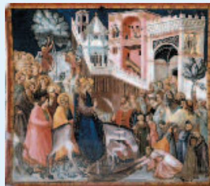
Pietro Lorenzetti (1280–1348) Vjezd do Jeruzaléma, bazilika sv. Františka, Assisi