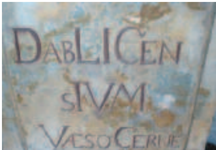
Nápis na podstavci sochy sv. Jana Nepomuckého na návsi, 18. 1. 2012

V současné době se v obci hledá „centrální náměstí“. Věřím, že to bude místo v blízkosti „komína“ bývalé cihelny, kde byl po něžné revoluci zlikvidován betonářský podnik PREFA, zdroj prachu a velkého hluku v centru obce. Tím se vytvořil prostor pro náměstí. Následně byly vypracovány minimálně dvě rozsáhlé studie (1996 a 2003). Tímto příspěvkem uvádím citlivý architektonický „vzor pro náměstí“ – naši návěs.