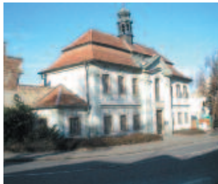
Kaple Nejsvětější Trojice, 18. 1. 2012