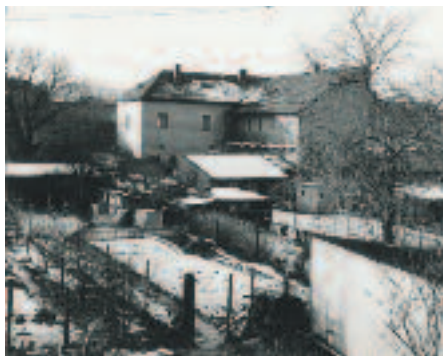
Konec 70. let – pavlačový obytný dům, který byl zbourán, na jeho místě pak bylo a vlastně i stále je parkoviště

Zahrádkářská kolonie – tak o historii této kolonky vím poměrně dost, protože zde mám přibližně 33 let pronajatou zahradu. Původně to byla zahrada v místě té lesní borovice, co tam dnes roste (tu jsem sám zasadil) a jasanu ve vnitrobloku (ten se tam vysemenil sám), nyní je to zahrada sousedící s dětským hřištěm. Téměř