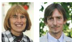
Pro Řáblický zpravodaj vybrali a zpracovali Táňa Dohnalová a Miloš Růžička

Další podrobné informace z jednání rady jsou k dispozici na webových stránkách MČ www.dablice.cz v rubrice Zápisy z Rady za rok 2012.