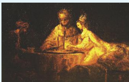
Achašveroš, Haman a Ester, Rembrandt van Rijn, 1660

Ve stejné době král Achašveroš povýšil Hamana, jednoho ze svých dvořanů. Haman ve své samolibosti a nadutosti žádá, aby se mu všichni lidé klaněli, Mordokaj však odmítá s tím, že se klanět může pouze Hospodinu. Haman z nepřátelství proti Mordokajovi osnuje