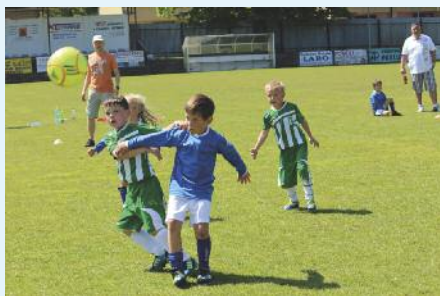
Nejtěžším soupeřem bylo mužstvo Bohemians 1905