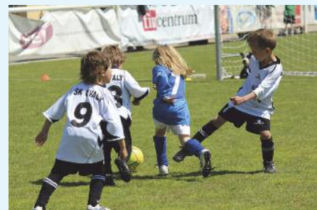
Souboj s domácími Rafany z Úval