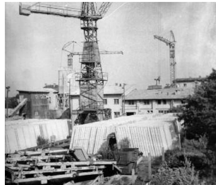
Betonárka Prefa uprostřed Ďáblic v roce 1980

Domeček patřil k cihelně, snad v něm bydleli cihláři. Dnes stojí cihelna v dolíku, to je ale způsobeno tím, že její okolí bylo znovu zavezeno. V době, kdy byla cihelna v provozu, byl okolní terén ve výšce cihelny. Na všechny strany od cihelny byla rovina, pouze domeček stál na výrazné vyvýšenině. Cihláři vystavěli cihelnu v prohlubni a následně všemi směry odkopávali a těžili cihlářskou hlinu. Teprve později byl terén okolo cihelny znovu navýšen návozem, například v souvislosti se stavbou silnice, dnešní Mannerovy ulice. Na úrovni dvorku za cihelnou, který je nejnižším položeným místem v okolí, byla značná část dnešní centrální části obce. Cihlářská hlína se těžila i v prostoru, kde byl později postaven biograf.