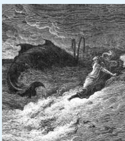
Jonáš vyvržený velrybou – Gustav Dor (1883)

Jonáš se nalodil na loď plující opačným směrem, a ta se dostala do nebezpečné bouře. Přiznal se námořníkům, že prchá před Hospodinem a žádal, aby jej vrhli do moře. Bouře ustala