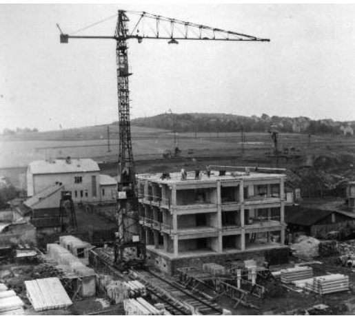
Stavba panelového domu v roce 1952