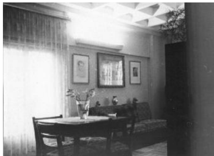
Interiér domu s kazetovým stropem

pomocí se později vyráběly kazetové stropy, které jsou jednou ze specialit Ďáblického paneláku. Samotnou výstavbu jsem ale nezažil, když jsem v roce 1954 přišel z vojny, dům už stál. Byl to první panelový dům v tehdejší Československé republice. Co se stalo s modelem, nevím, nejspíš ho zrušila Prefa, která přišla na místo stavebních závodů. To, že se model nezachoval, je každopádně škoda.