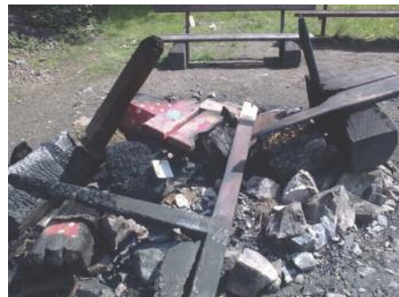
Idylický obrázek „kultivovaného táboření z piknikového místa u altánku v Ďáblickém háji. Tak to by nedokázal ani pes puštěný bez dozoru a dokonce bez náhubku“.