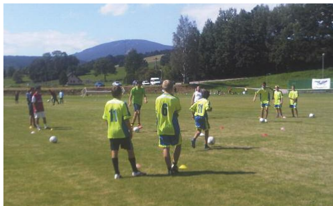
Mladší dorost trénuje na hřišti Mladé Buky s výhledem na Černou horu

Letošní léto vyjely dvě skupiny na dvě různá místa – mladší dorost a starší žáci do Mladých Buků v Krkonoších a starší a mladší příprava včetně minipřípravky (do prázdnin ještě školička) do Přimdy u Tachova. Z Mladých Buků se starší kluci vrátili již 23. 8., soustředění na Přimdě v době uzávěrky Zpravodaje probíhá. Každopádně druhému soustředění se určitě budeme věnovat v příštím Zpravodaji, a tak se čtenáři mohou těšit na zajímavé informace a hezké fotografie. Kdo by nemohl vydržet, tak si může přečíst informace a prohlédnout fotogalerii na stránkách www.skdablice2006.estranky.cz . Jinak jsem samozřejmě rád, že se nám podařilo od Magistrátu hl. m. Prahy získat dotaci na dopravu ve výši 20 000 Kč.