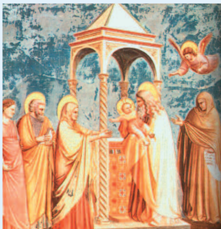
Uvedení do chrámu, kolem r.1305, Giotto di Bondone, Cappella Scrovegni, Padova

Vždy 2. února, čtyřicet dní po narození Ježíše, si církev připomíná událost zapsanou v Lukášově evangeliu (Lk 2,22-40). Ježíšovi rodiče, Josef s Marií, přinesli malého Ježíše do chrámu v Jeruzalémě, aby podle židovských zvyklostí vykonali povinnost očišťování a představení prvorozeného syna, který byl vždy podle zákonů zasvěcen Bohu. Na pozadí příběhu vystupují dvě postavy, stařec Simeon a prorokyně Anna, oba hluboce věřící, zbožní lidé na sklonku svého života. Simeon vítá rodiče a přiznává se k Ježíši jako k dlouho očekávanému mesiáši známým chvalozpěvem: „Nyní propouštíš v pokoji svého služebníka, Pane, neboť mé oči viděly tvé spasení, které jsi připravil přede všemi