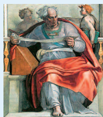
Michelangelo Buonarroti (1475–1564), vyobrazení proroka Jóela v Sixtinské kapli

Jeden z tzv. malých proroků Jóel (jeho jméno – Hospodin je Bohem – je zároveň vyznáním) je autorem spisu (9. st. př. Kr.), kterým bojoval proti pohanům a nepřátelům Izraele. Staví je před soud, ale zároveň vyjadřuje naději pro všechny, kteří se hlásí k Božímu lidu. Jóel, podobně jako ostatní proroci, vyzývá k pokání