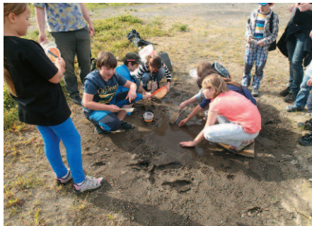
V červnu jsme uskutečnili záchranu pulců z vysychající louže, která zbyla po původním rozsáhlém močálu

V tématech „výchovných“ schůzek dodržujeme logickou posloupnost. Od základů geologie a paleontologie, které nám umožňují pochopení historického vývoje Země a života, jsme pokračovali tématem o vodě a půdě k základním podmínkám pro život na naší planetě. Astronomie a vulkanologie nám zase poskytly pohled na způsob, jakým pohyby slunce a měsíce, roční období a také tvar kontinentů a jejich reliéf ovlivňují klima na různých částech naší planety. Po tomto úvodu plánujeme věnovat pár schůzek počasí v různých částech světa, a nakonec se tak dostaneme až k definici přírodní niky a biotopu. Budeme pak pokračovat přes botaniku a seznámení s tím, jak se rostliny podílejí na utváření prostředí pro vyšší organismy až k živočichům, včetně lidí.