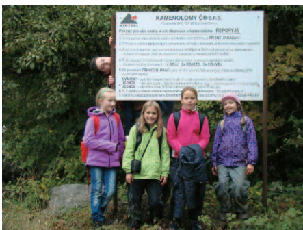
Z náročné geologicko-paleontologické exkurze

Letošní zpráva z málo známého dáblického oddílu MOP (mladí ochránci přírody) Sídlem oddílu je Ekocentrum v Kokořínské 2 (křižovatka s Květnovou). Je zde klubovna pro schůzování, biomístoprojekt terárií pro blízké seznámení s plazy a drobnými savci, jakož i zahrada s jezírkem pro venkovní hry. K výstavě Ekocentra patří možnost prezentace foto- a videosouborů s tematikou přírody a její ochrany, mikroskop s adaptérem pro snímkování, dalekohled, nafukovací čluny, základní výbava pro horolezecké jištění, potřeby pro činnost v přírodě. Oddíl má v současnosti 19 členů, převážně z řad žactva školy U Parkánu, stále se nám hlásí další zájemci. O jejich program se starají tři trvalí oddíloví vedoucí s občasnými vstupy dalších příznivců z řad ZO ČSOP. Od dalšího školního roku předpokládáme nábor dalších lektorů, zejména hudebně aktivních, použitelných pro ekoartedukaci – a uvažujeme o rozdělení rostoucího dosavadního jednoho oddílu dětí na dva hlavně podle věku. S ukázkami našich aktivit je možno se seznámit v obrazové vitrině vpravo od vchodu do Ekocentra. Pravidelné schůzky jsou vždy tematicky zaměřené na konkrétní aspekt ochrany přírody. Teoretickou výuku doprovázíme názornými věcnými příklady i obrazovou dokumentací. Celou schůzku pak doplňují krátké individuální i kolektivní hry sloužící nejen k zábavě a výcviku šikovnosti, ale i vstřípení klíčového aspektu daného tématu, který tvoří v soutěži hlavní prvek, jako např. princip potravní pyramidy nebo