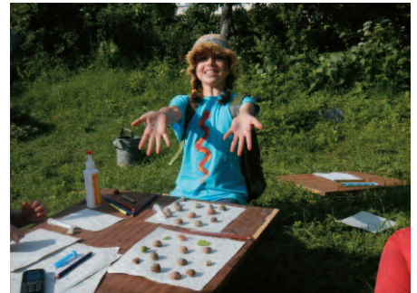
Měkčíši fauna naší zahrádky

tově jsme odložili připravený program a usku-tečnili místo toho záchrannou výpravu. Menší kaluž byla již vyschlá a pokrytá uschlými tělíčky mrtvých pulečků. K té větší jsme přišli včas, pulečky vylovili, sami se poněkud zabahnili, ale s pocitem, že si zasloužíme název svého oddílu, jsme je pak vypustili v tůni mezi Dáblicemi a skládkou.