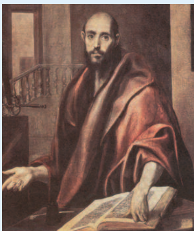
El Greco, Svatý Pavel (1580-1586), soukromá sbírka

„Jsou rozdílná obdarování, ale tentýž Duch, rozdílné služby, ale tentýž Pán. Jednomu je skrze Ducha dáno slovo moudrosti, druhému slovo poznání, někomu zase víra, jinému dar uzdravování v témž