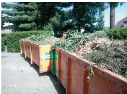
Kontejnery u úřadu MČ

Tak jako minule vám s vykládkou vašeho bioodpadu pomohou brigádníci. Na stanovišti u úřadu si občané mohou seštěpkovat větve a štěpku si vzít zpět. Štěpka, která zůstane, je zdarma k odběru na místě. Štěpkovač bude v provozu každou druhou sobotu a maximálně hodinu, kvůli omezení hlučnosti. Pokud nebude dostatek dřevní hmoty ke zpracování, bude se štěpkovat až další sobotu. Pokud u kontejneru v ulici Chřibská bude potřeba zpracovat dřevní odpad na štěpku, bude tam štěpkovač přemístěn. Podmínky provozu budou stejné jako u úřadu. Za šest sobot provozu štěpkovače bylo