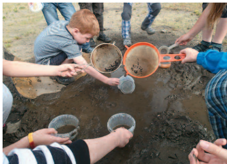
Každý si nalovil nejméně stovky pulců

Zatímco v zimním období a nepříznivém počasí jsme se věnovali spíše teoreticky první části názvu oddílu (poznání), s příchodem příjemných teplot stále více opouštíme klubovnu v Ekocentru a přírodní zajímavosti sledujeme v okolí – na příklad u blízkých jezírek za hvězdárnou, kde jsme s potěšením ověřili trvalý výskyt čolků a u velkého jezírka před lesem dokonce vyplašili užovku.