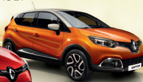
RENAULT CAPTUR OD 103 300 Kč PŘI ENERGY FINANCOVÁNÍ NA 1/3

• NYNÍ S ENERGY FINANCOVÁNÍM NA 1/3 S 0% ÚROKEM • BONUS 15 000 Kč PŘI VÝKUPU VAŠEHO STARÉHO VOZU