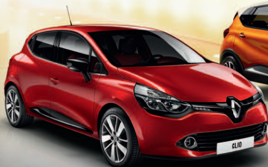
RENAULT CLIO OD 76 633 Kč PŘI ENERGY FINANCOVÁNÍ NA 1/3