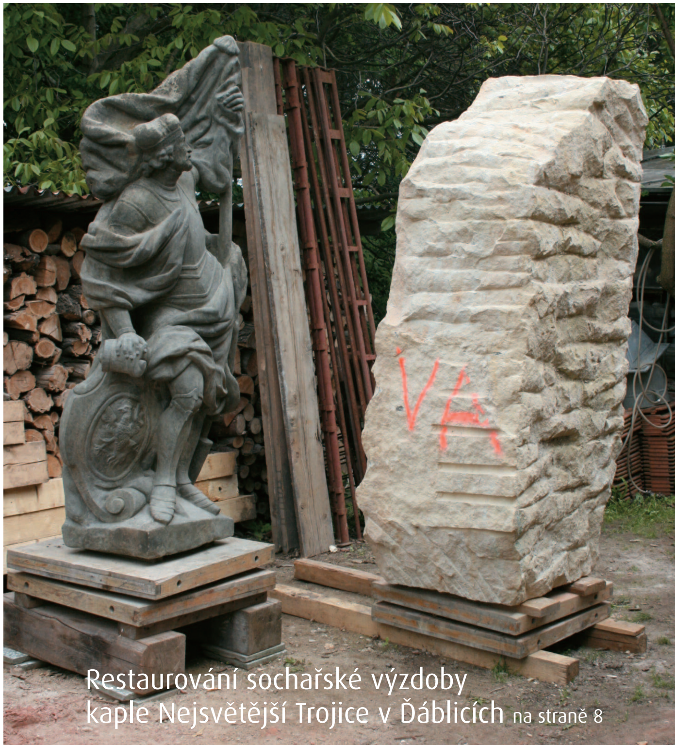
Restaurování sochařské výzdoby kaple Nejsvětější Trojice v Ďáblicích na straně 8