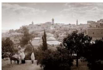
Pohled na město Betlém, foto z r. 1898, autor neznámý

Město Betlém (hebr. dům chleba), vzdálený 10 km od Jeruzaléma, se uvádí v Matoušově evangeliu jako místo Ježíšova narození. V historických dobách malá vesnice, dnes město s 25 000 obyvateli, kam se sjíždějí poutníci z celého světa. Sídí zde jedna z nejstarších křesťanských komunit. K Betlému se vztahuje i předpověď proroka Micheáše