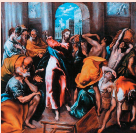
Jedním z biblických textů vystihující myšlenku postní doby je perikopa Očištění chrámu (Janovo evangelium, 2. kap.), podle které byl namalován obraz Vyhnání obchodníků z chrámu, El Greco, r. 1600, Národní galerie, Londýn

V postu je člověk bdělý a otevřený pro duchovní věci a pro Boha, přivádí nás do Boží blízkosti. Proto půst často doprovází modlitbu, navzájem