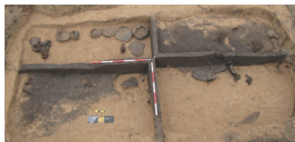
Druhý hrob během výzkumu.