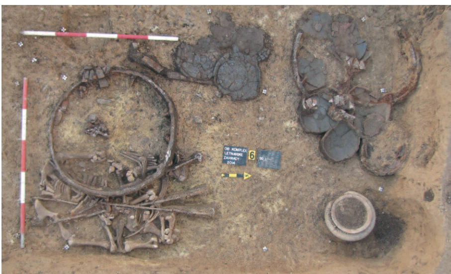
Část pohřební výbavy z komorového hrobu. Celá nádoba je zachována v rohu vpravo dole. Části zvířecích skeletů jsou uprostřed dole kolem tří železných rožňů. Na tuto skupinu nálezů se zhroutil dvě z kol vozu.

v rozích. Oproti předchozímu nálezu neležely kosterní pozůstatky na voze, v hrobové jámě však bylo uloženo bronzem zdobené jho a součásti koňského postroje, podobně jako v předchozím případě. Při pravém boku pohřbené osoby stála sada malovaných nebo tuhovaných nádob a za nimi byly uloženy části kosterních pozůstatků z mladého skotu a menšího bravu. Součástí pohřební výbavy byl také železný hrot kopí a bronzové náramky.