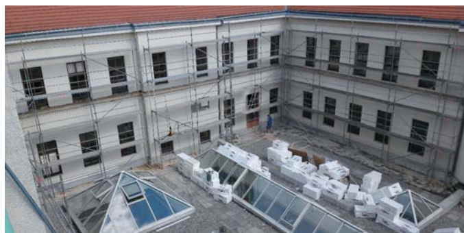
...a dostavba v roce 2015.