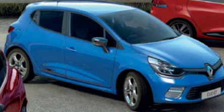
Renault CLIO GT