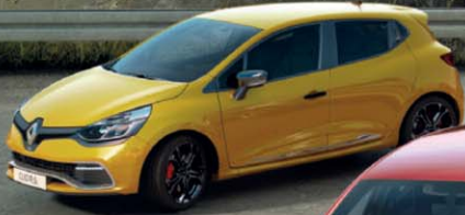
Renault CLIO RS