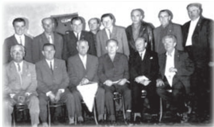
Funkcionáři a členové klubu při udílení pamětní medaile k 50. výročí založení

V této soutěži skončilo družstvo na 7. místě s těmito výsledky: 10 výher, 5 nerozhodně, 11 proher, skóre 57:48, 25 bodů. Dorost hrál III. třídu – oddě-