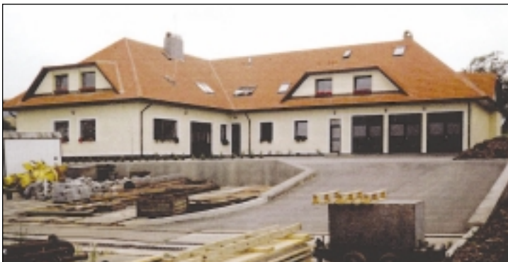
Provozní a obytný dům, Přebuz