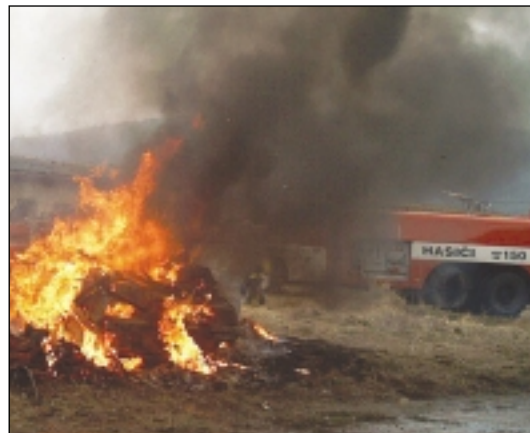
Výsledek spalování odpadu

ních krbech nebo otevřených grilovacích zařízeních spalovat jen dřevo, dřevěné uhlí, suché rostlinné materiály a plyná paliva, určité výrobce, přičemž uvedená paliva nebo materiály nesmí být kontaminovány chemickými látkami.