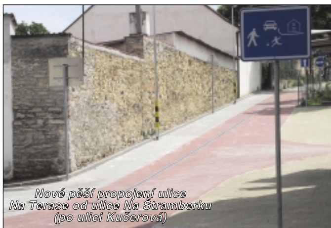
Nové pěší propojení ulice Na Terasě od ulice Na Štramberku (po ulici Kučerová)