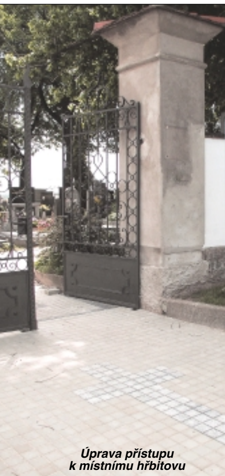
Úprava přístupu k místnímu hřbitovu