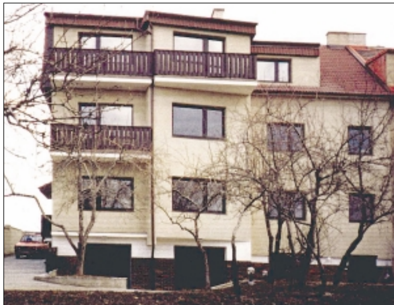
Vila v Praze 9