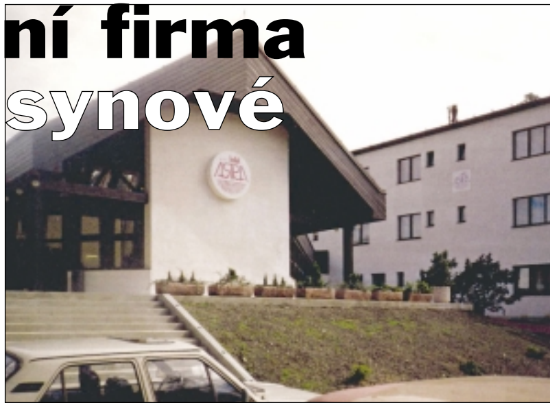
Hotel Astra, Srby u Kladna