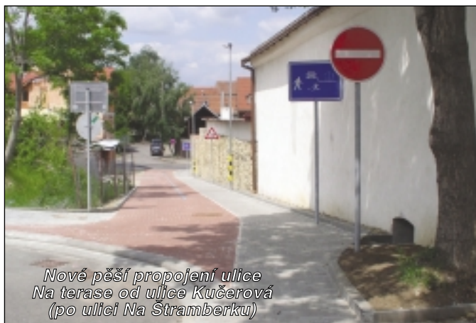
Nové pěší propojení ulice Na terase od ulice Kučerová (po ulici Na Štramberku)