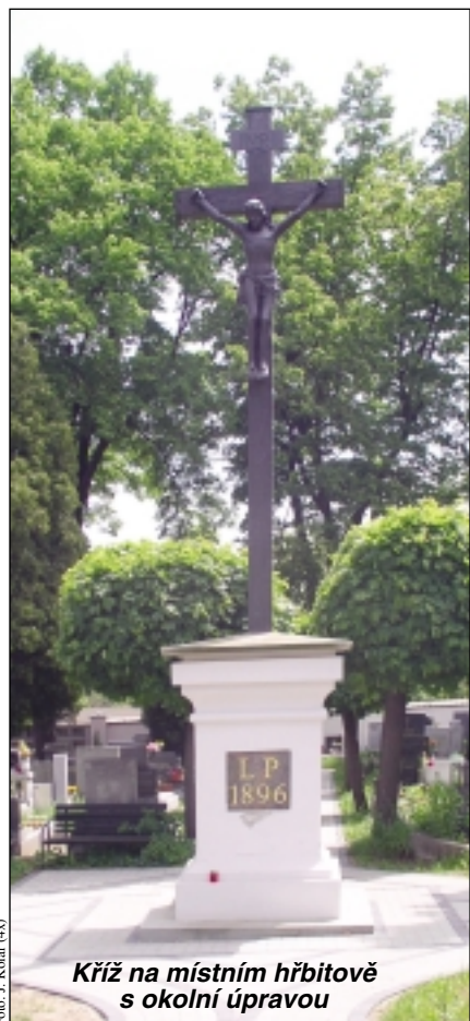
Kříž na místním hřbitově s okolní úpravou