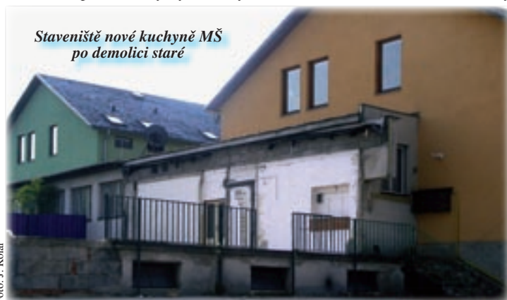
Staveniště nové kuchyně MŠ po demolici staré