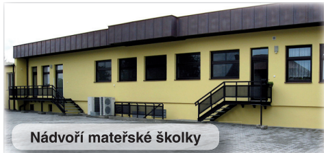
Nádvoří mateřské školky