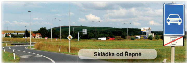
Skládka od Řepné