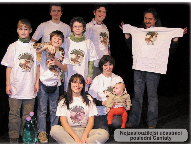
Nejzasloužilejší účastníci poslední Cantaty

story nebylo tehdy snadné. Po řadě neúspěšných pokusů a jednání se mi podařilo získat za výše uvedený honorář (i když úředně za 40 000 Kč) domek se zahrádkou na rohu Kokořínské a Květnové od pana Polcara. Tolik na úvod.