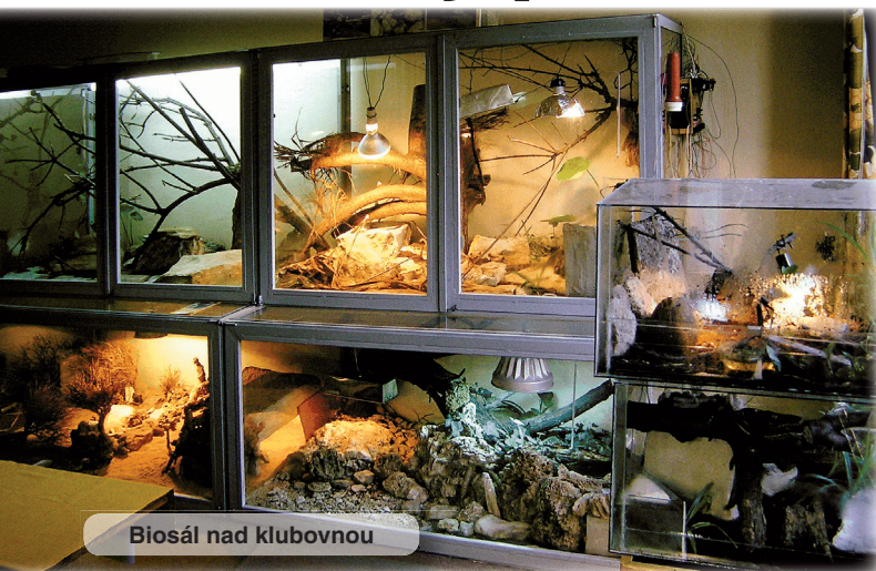
Biosál nad klubovnou