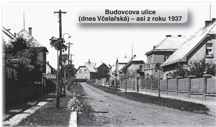
Budovcova ulice (dnes Včelařská) – asi z roku 1937

Hlavní zástavba proběhla v letech 1924 - 1938. Naše ulice se jmenovala Budovcova, dostali jsme číslo popisné 521. Jména Ďáblických ulic, převážně podle našich historických osobností, byla dílem tehdejšího starosty Nováka.