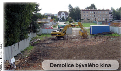
Demolice bývalého kina