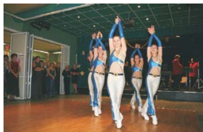
Fitness Center Hanky Šulcové