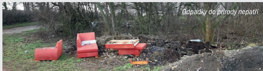
Odpadky do přírody nepatří

U bažantnice (nad ulicí Statková) se objevila další černá skládka – nepotřebná pohovka, zbytky z květináčů a listů, hromádky hlíny... Do lesíka byly odhozeny v noci. Proč je majitel nedovezl do sběrného dvora, kam je to blíž, vede tam pohodlnější cesta, je to zdarma a bez rizika, že ho někdo uvidí? Takto za peníze „všech“ budeme zajišťovat odvoz do sběrného dvora my. Připomínáme, že na duben a květen zajišťujeme zvýšený počet kontejnerů na podobný velkoobjemový odpad, které budou rozmístěny po celých Ďáblicích! Termíny jsou již na webových stránkách, budou ještě připomenuty i ve Zpravodaji!