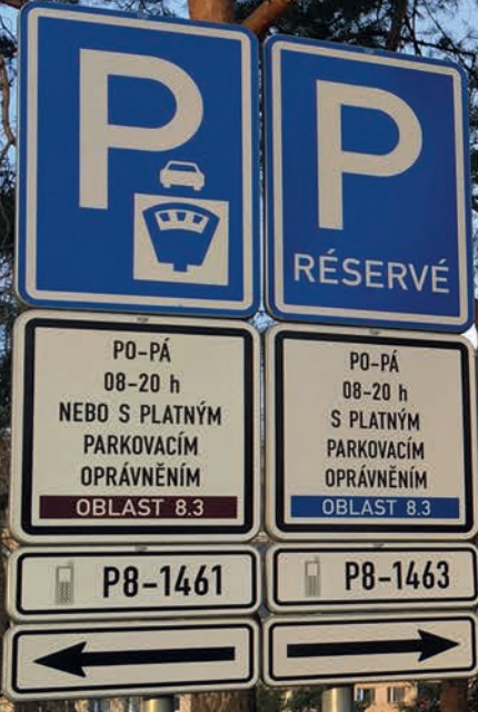
Orientace v dopravním značení je základem úspěchu