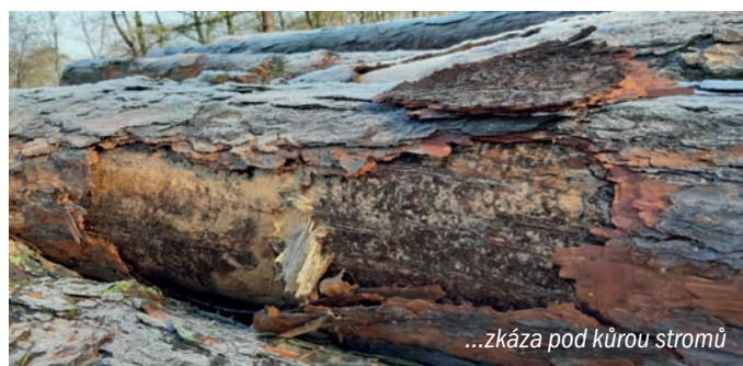
...zkáza pod kůrou stromů