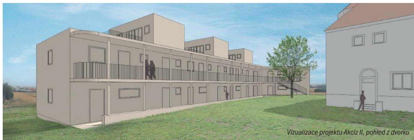
Vizualizace projektu Akciz II, pohled z dvorku