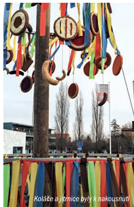
Koláče a jitrnice byly k nakousnutí

Nejzajímavější masopustní fotografie zachycené Pavlem Veselým najdete v galerii na webu dablice.cz/fotogalerie-z-dablic .