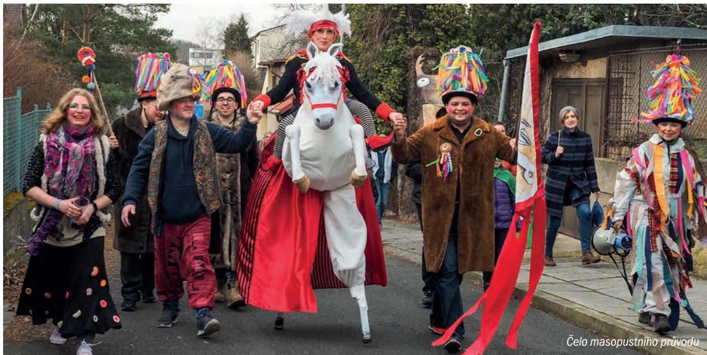
Čelo masopustního průvodu