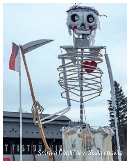
Smrtka Ďáblíčáky děsila i bavila