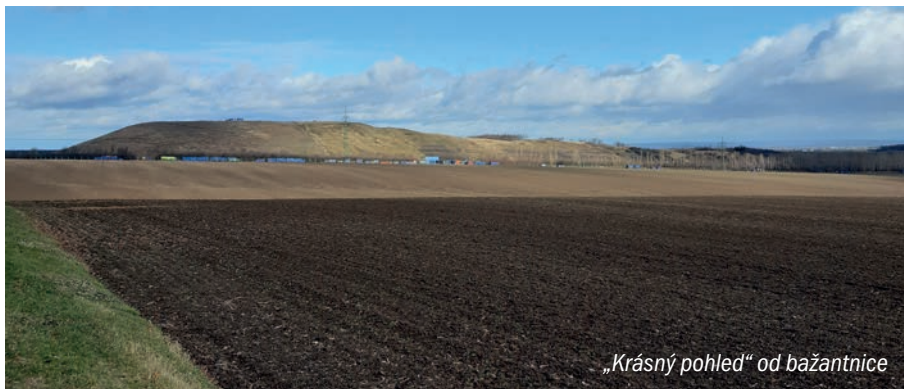
„Krásný pohled“ od bažantnice

Provozní doba překládací stanice je stanovena od 7 do 20 hod. v pracovních dnech, o sobotách pouze do 15 hod. Vydaný souhlas má platnost do 30. 6. 2025.