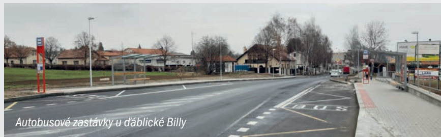
Autobusové zastávky u Ďáblické Billy

Od pátku 24. 1. 2020 jsou v provozu nově vybudované zastávky autobusových linek 103, 348, 368, 369 a 914 u supermarketu Billa. Zastávky Na Fabiánce jsou na znamení! Upozorňujeme, že pro návrat zpět do Ďáblic je nutné přejít hlavní silnici po přechodu u ulice Na Fabiánce. Umístění přechodu blíže obchodu nebylo možné z důvodu rozhledových vzdáleností. Na zastávkách bude ještě probíhat odstraňování drobných nedodělků a definitivní ho dopravního značení.