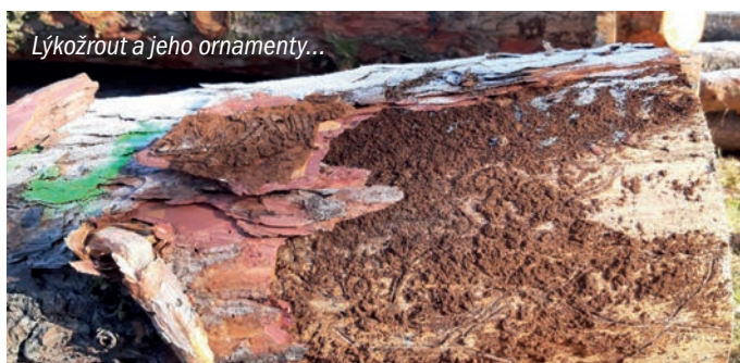
Lýkožrout a jeho ornamenty...