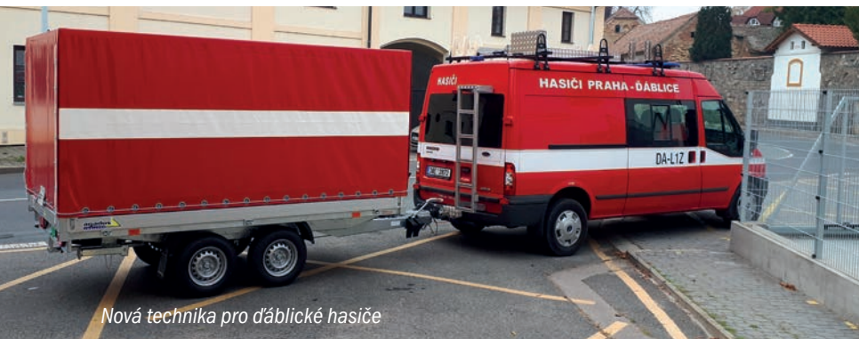
Nová technika pro Ďáblické hasiče

Sledujte prosím aktuální zprávy na webu MČ Ďáblice (dablice.cz), připomeňte si informační leták „Pomoc při koronavirové krizi“, který byl roznesen do všech poštovních