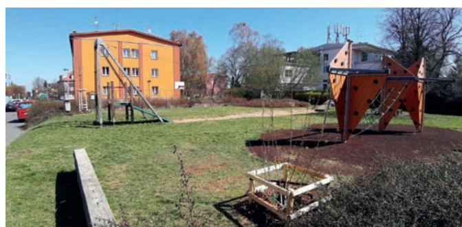
1x třešeň ptačí; 2x javor amurský