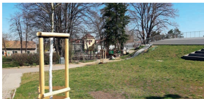
2x platan javorolistý