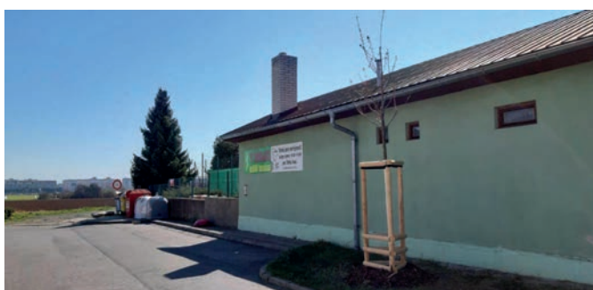
1x třešeň pilovitá