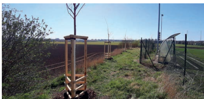
1x třešeň pilovitá; 9x dub letní