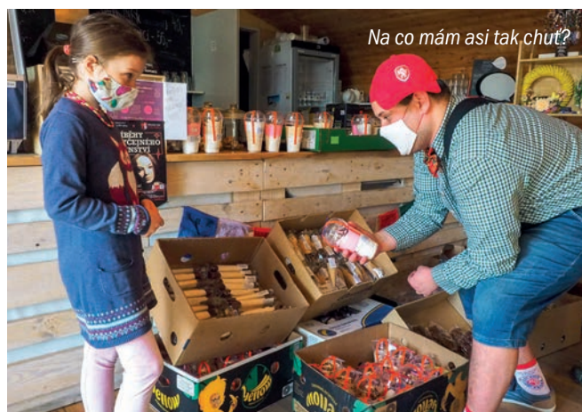
Na co mám asi tak chuť?