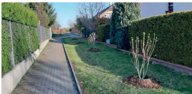
8x šeřík obecný