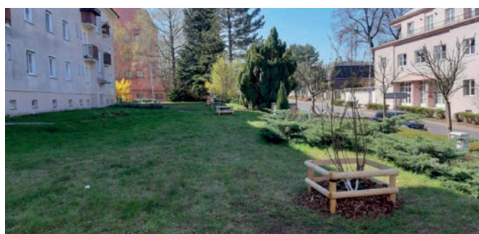
1x javor amurský; 2x třešeň jedoská