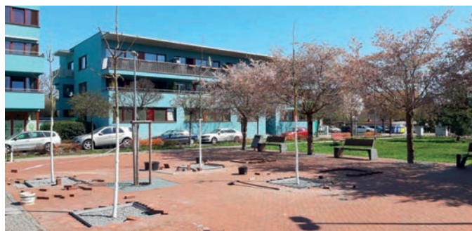
4x svitel latnatý