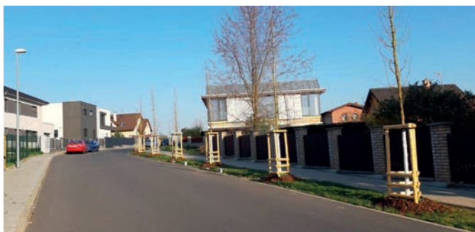
22x javor babyka