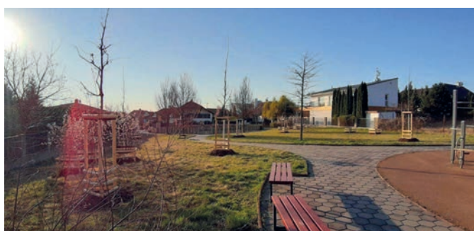
10x muchovník Lamarckův; 2x javor amurský; 3x jinan dvojlaločný; 2x svitel latnatý; 3x platan javorolistý; 4x dub šarlatový