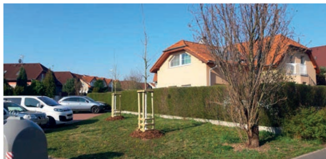
2x platan javorolistý