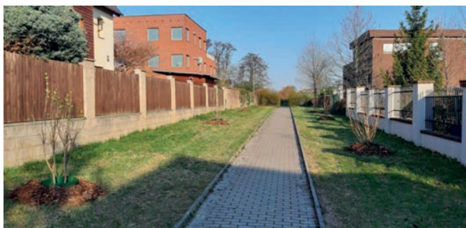
10 x šeřík obecný