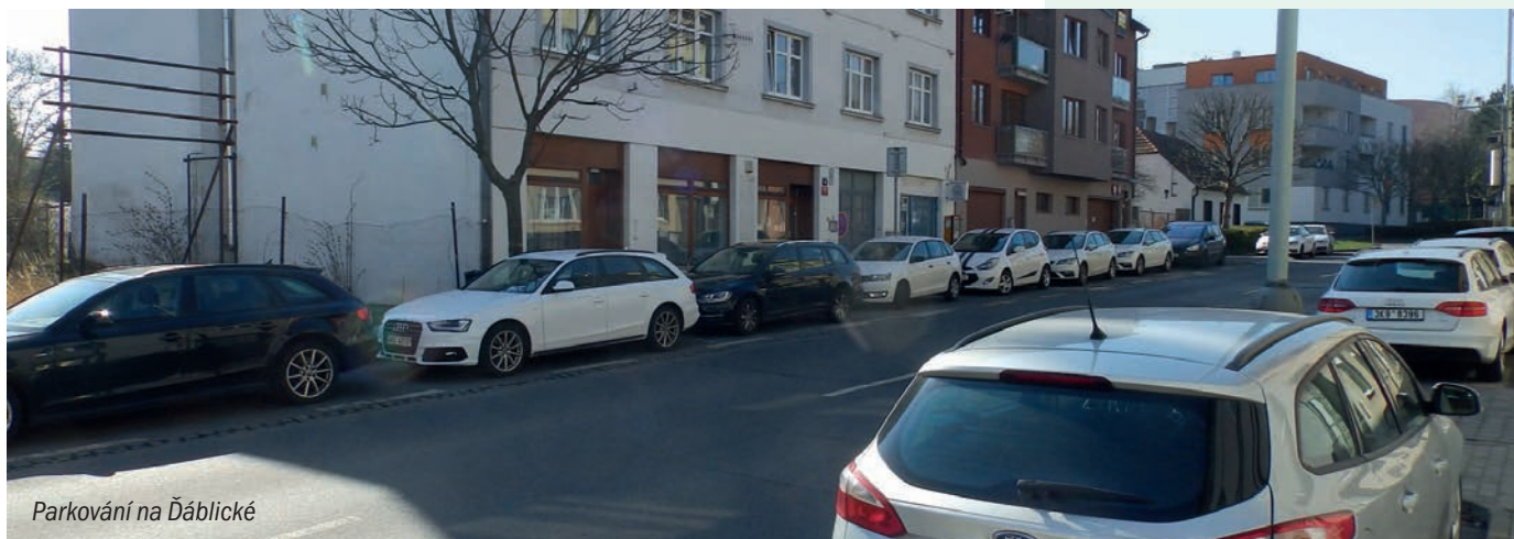
Parkování na Ďáblické