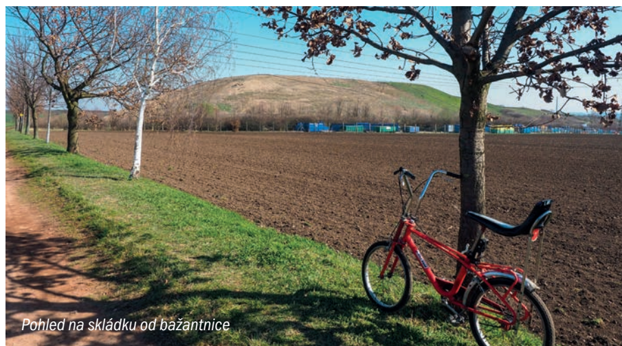
Pohled na skládku od bažantnice

Městská část Praha-Ďáblice, Osinalická 1104/13, 182 00 Praha-Ďáblice