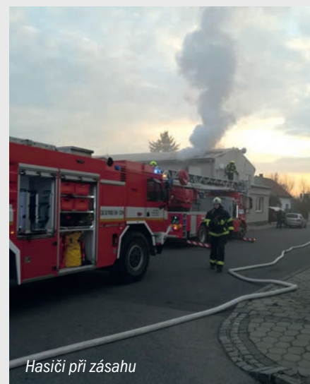
Hasiči při zásahu

Za vedení MČ Jan Hrdlička