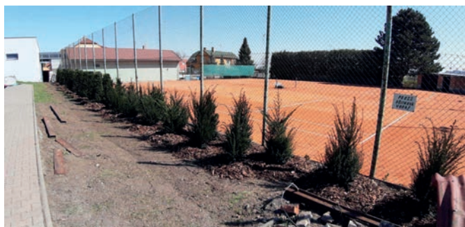
45x tis červený