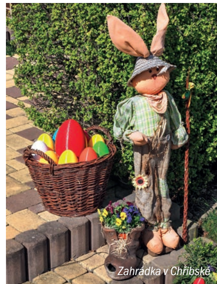
Zahrádka v Chříbské

Přestože byly letošní Velikonoce pro nás všechny úplně jiné, chtěli jsme si jejich atmosféru připomenout tradicí. Takto se nám proměnil strom u Komunitního centra Vlna. Různobarevné kraslice věnoval kroužek Šikovné ruce a vlastní tvorbou zdobili i další sousedé.