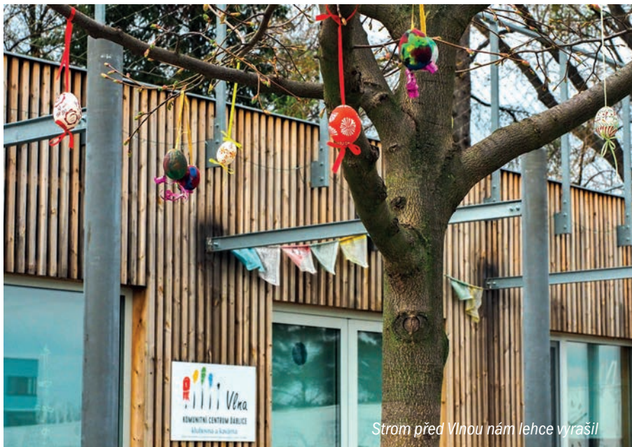
Strom před Vlnou nám lehce vyrašil