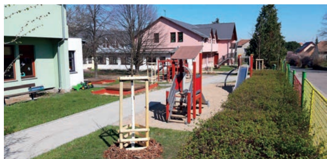
1x kaštanovník jedlý; 3x třešeň ptačí