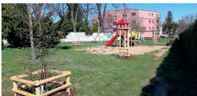
1x javor babyka; 3x hloh obecný; 2x jabloň mnohokvětá; 2x třešeň ptačí; 1x jeřáb břek