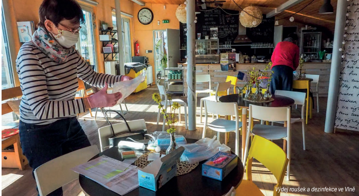
Výdej roušek a dezinfekce ve Vlně

schránek. Nejrychleji se k vám nejdůležitější informace a upozornění dostanou pomocí SMS Mobilního rozhlasu, který provozujeme náhradou za již mnoho let nefunkční tzv. rozhlas – vzpomínáte na křičící, neovladatelné a věčně reklamované rádiové přijímače? Zaregistrujte se i vy na prahadablice.mobilnirozhlas.cz