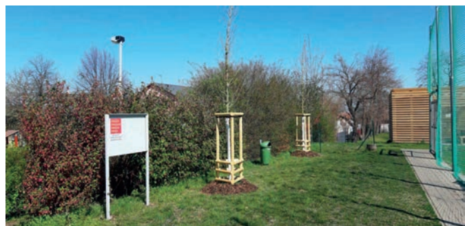
2x javor babyka