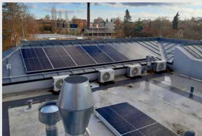
Fotovoltaika na starém obecním domě Ke Kinu.