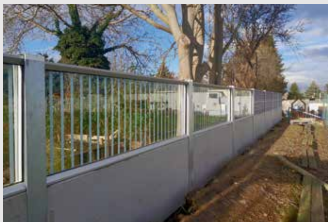
Protihluková stěna SK Ďáblice.