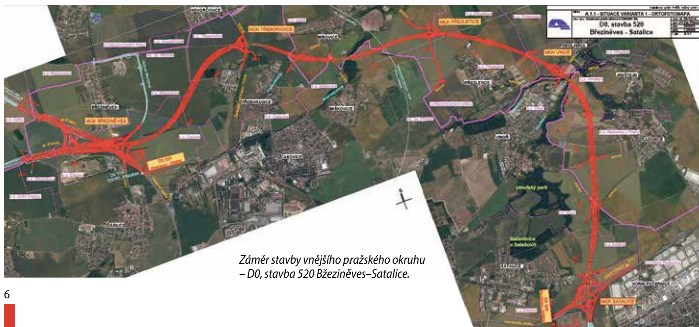
Záměr stavby vnějšího pražského okruhu – D0, stavba 520 Březiněves–Satalice.