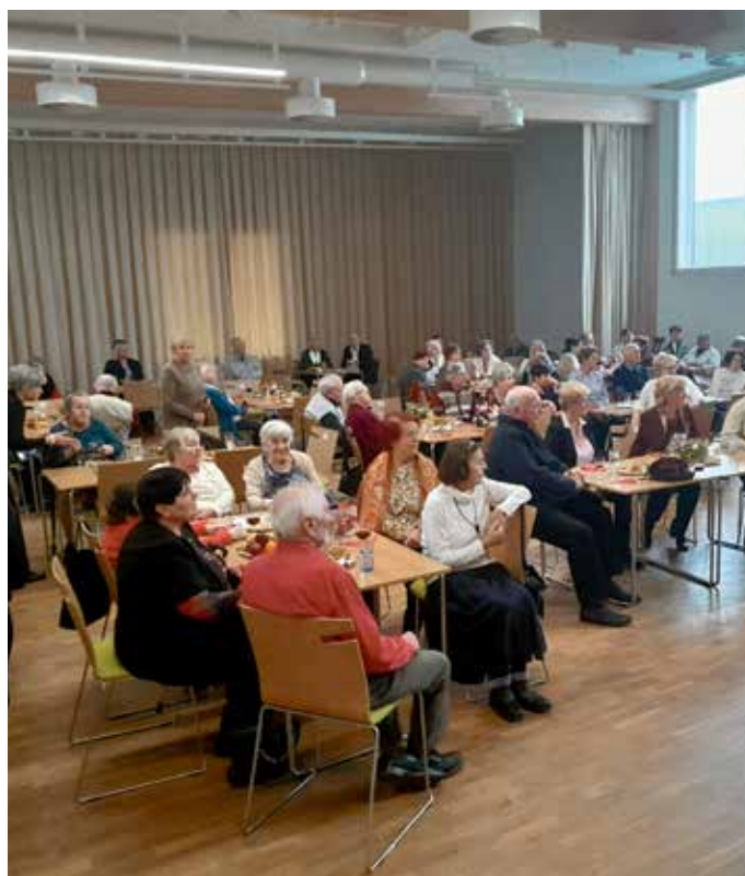
Vánoční posezení seniorů.