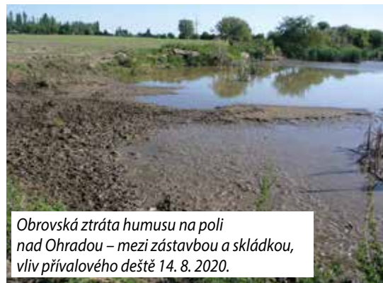
Obrovská ztráta humusu na poli nad Ohradou – mezi zástavbou a skládkou, vliv přívalového deště 14. 8. 2020.

žován. Nejde jen o Ďáblice, jde o majetky ve Veleni, Sluhách, v Mratíně – na toku potoka. Tím, že píši seriál o Mratínském potoku a cestuji krajinou potoka, nepřehlédnu, kde v okolí reagují radní na změnu klimatu a ovlivňují odtok dešťů drobnými i většími úpravami. Na webu Spolek pro Ďáblice v rubrice Ostatní zviditelňují práci okolních zastupitelstev (Čakovice, Líbeznice, Miškovice, Zlonín) řadou fotografií.