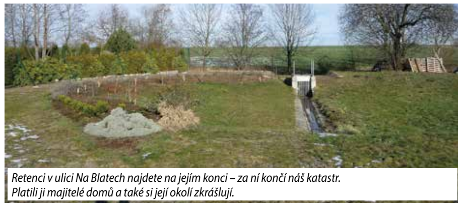
Retenci v ulici Na Blatech najdete na jejím konci – za ní končí náš katastr. Platili ji majitelé domů a také si její okolí zkrášlují.

MČ, můžeme zmírnit záplavy v dolní části Ďáblic. Tedy za předpokladu, že by se zde vybuďovala malá retenční nádrž. Řeknete, není to moc. Miliony na velké retenční nádrže u prameniště Mratínského potoka ve státní kase nyní nejsou. Zadržet vodu v krajině Ďáblic by mělo být v zájmu majitelů zemědělské půdy i soukromých osob, jejichž majetek je přívalovými dešti ohro-