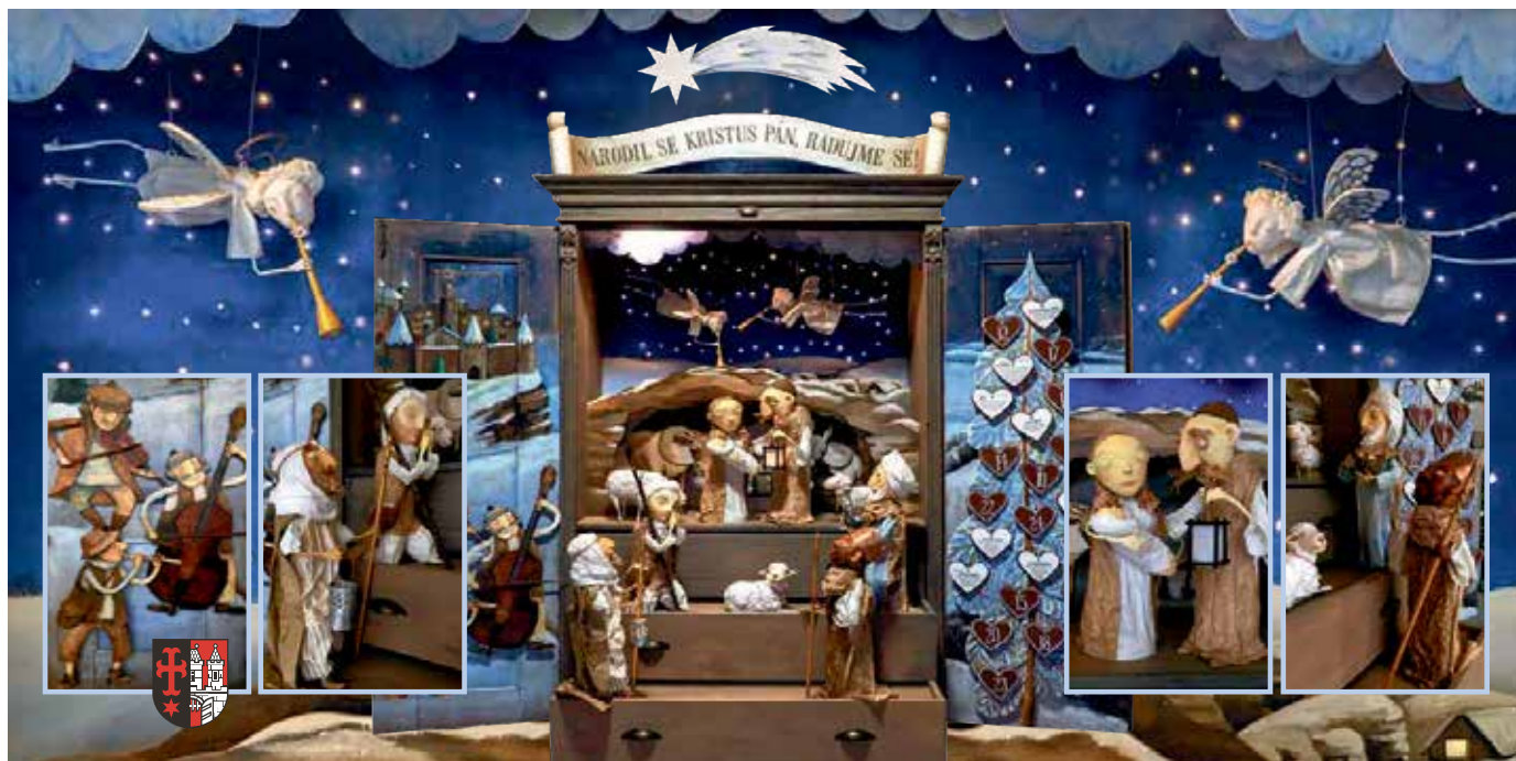
Betlém Městské části Praha-Ďáblice z dílny Báry a Jana Sládkových