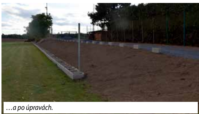
...a po úpravách.