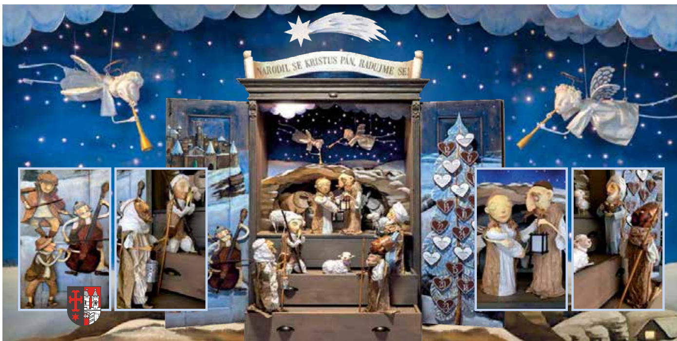
Betlém Městské části Praha-Ďáblice z dílny Báry a Jana Sládkových