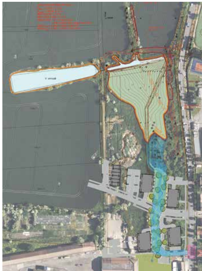
Hlavní retenční nádrž a část koridoru A pro odvodnění Ďáblic.

1. Hlavní retenční nádrž nad Ďáblickou, u prameniště. V současnosti je hotová dokumentace, shromažďují se stanoviska pro územní rozhodnutí. RK vznikne na pozemku Rytířského řádu Křížovníků s červenou hvězdou (RŘK), na základě smlouvy mezi RŘK a MČ. Dokumentaci a výstavbu na sebe vzal odbor péče o prostředí pražského Magistrátu. Ukázalo se, že jednoduchá sypaná hráz vytvoří retenční objem 3,5 tisíce m 3 . Objem RN je zcela dostatečný, aby pojal i extrémní srážky. Je předpoklad, že se podaří zajistit